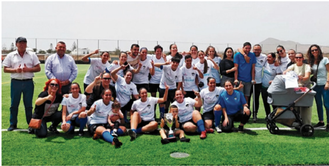
CD Atlético Balompédica.

La cantera es una de las señas de identidad del CD Atlético Balompédica Isla Tranquila, club que en la actualidad cuenta con nueve equipos y en cuya estructura juegan cerca de 150 niños y niñas. “Nuestra idea es la formación de jugadores y jugadoras, aunque para ello tengamos la dificultad de poder encontrar entrenadores”, comenta