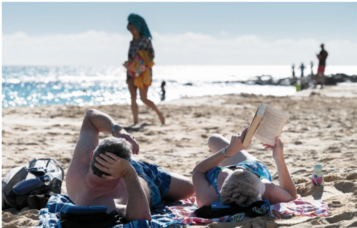
Turistas tomando el sol en la playa.

El resultado es un modelo cada vez más caro. Suben los billetes de avión, aumentan las tasas, se encarecen los servicios y el turista, de momento, lo asume sin rechistar. De hecho, lo está asumiendo con una sorprendente resiliencia, lo que explica