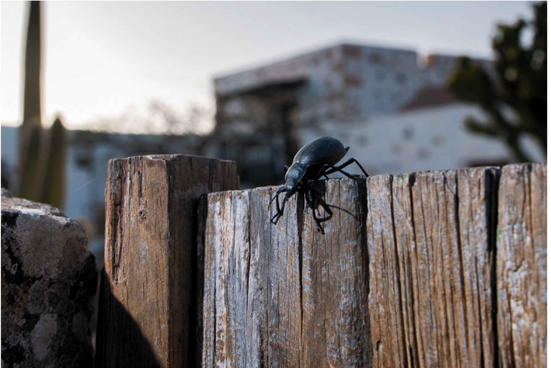
Un individuo de blaps canario (' Lithoblaps alternans ') pasea por un terreno rural.