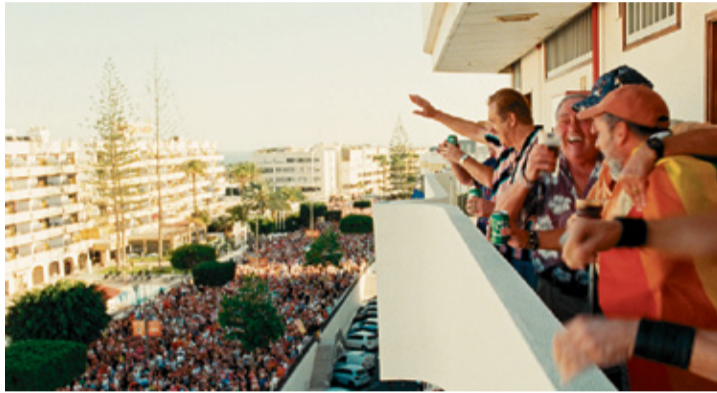
Escena de la película 'Maspalomas', rodada en el sur de Gran Canaria.