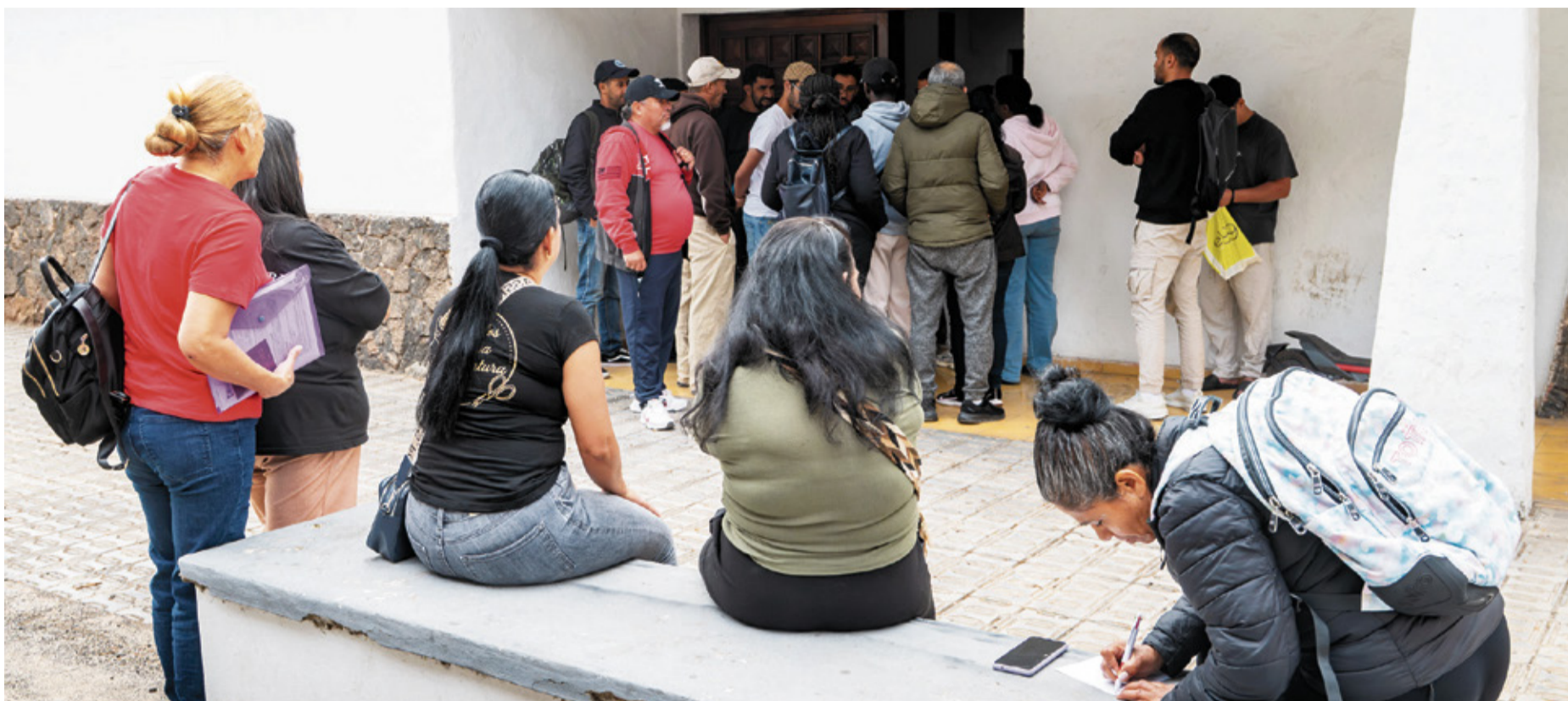
Solicitantes de la regularización, en la sede de Entre Mares.

el texto definitivo dejó fuera al colectivo.