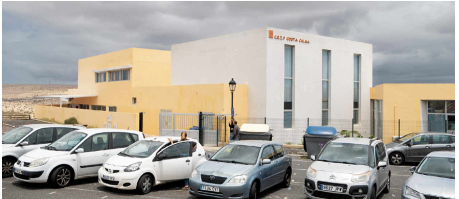
CEIP Costa Calma.

Fuentes de la Consejería de Educación del Gobierno de Canarias comunican que se “se está tramitando la cesión de los terrenos municipales, por parte del Ayuntamiento de Pájara, aledaños al colegio” de Cos-