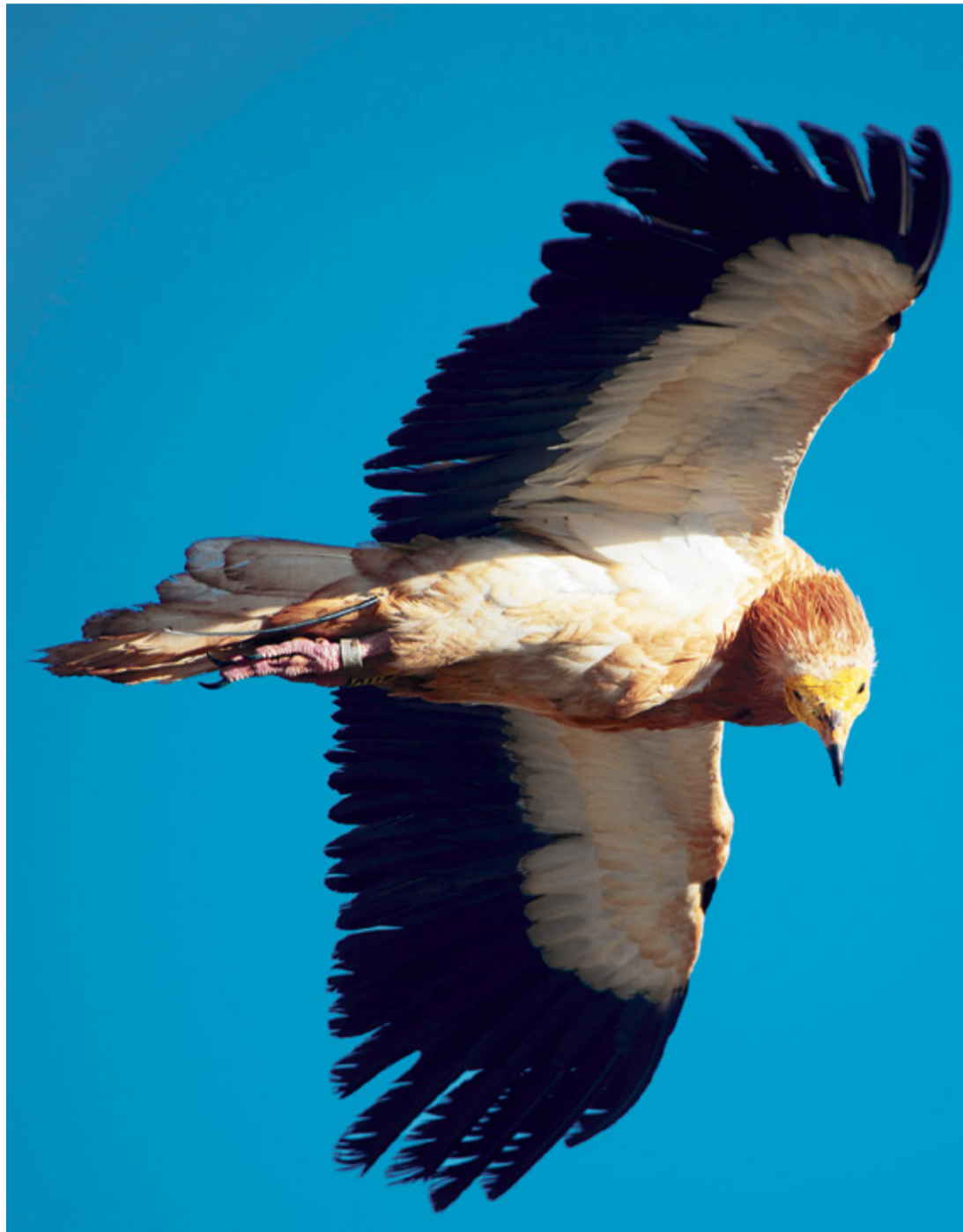
Guirre en Fuerteventura.

Para despejar cualquier duda sobre tan singular puerta, el es-