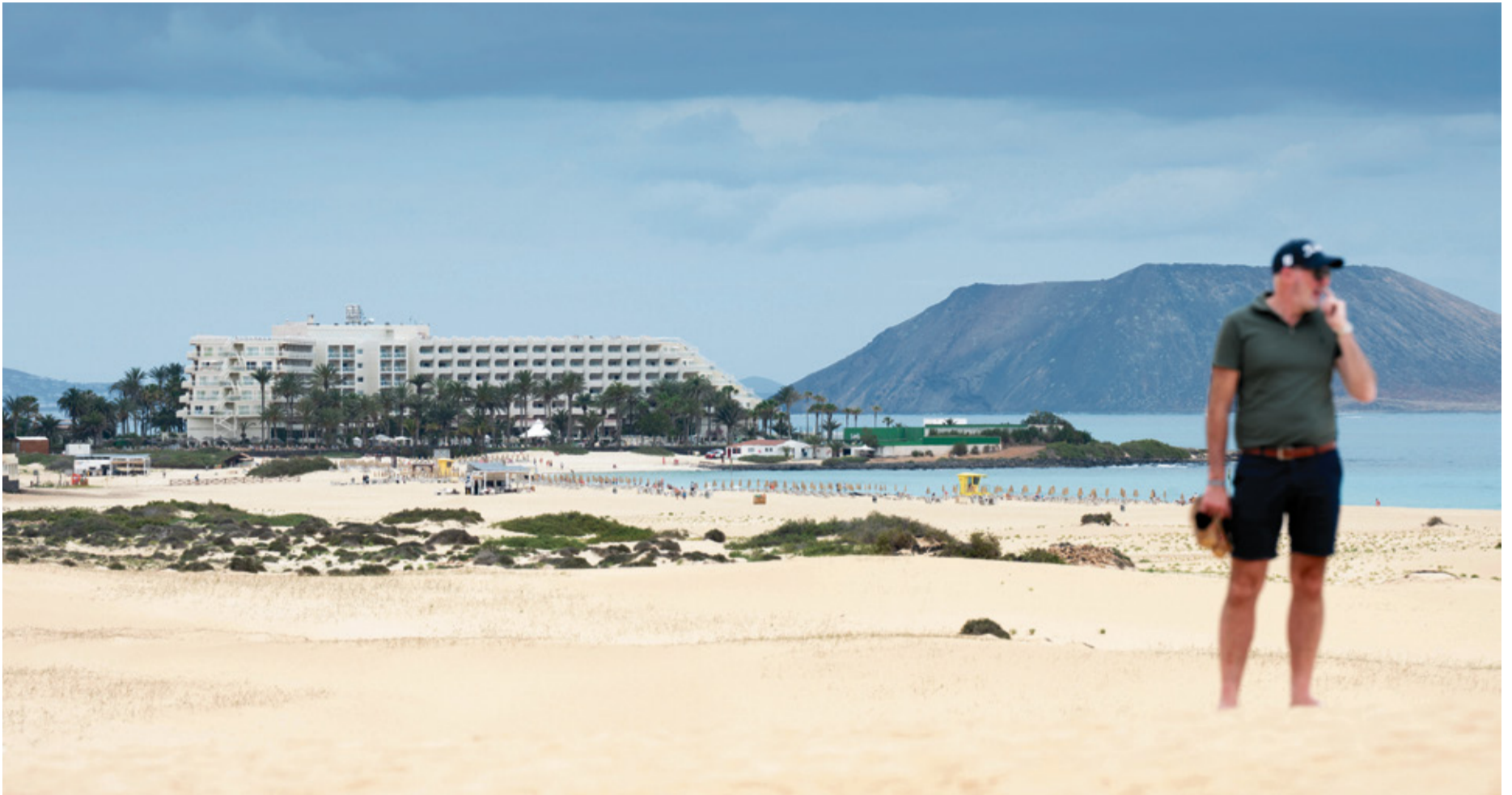
Hotel Tres Islas de la cadena RIU.