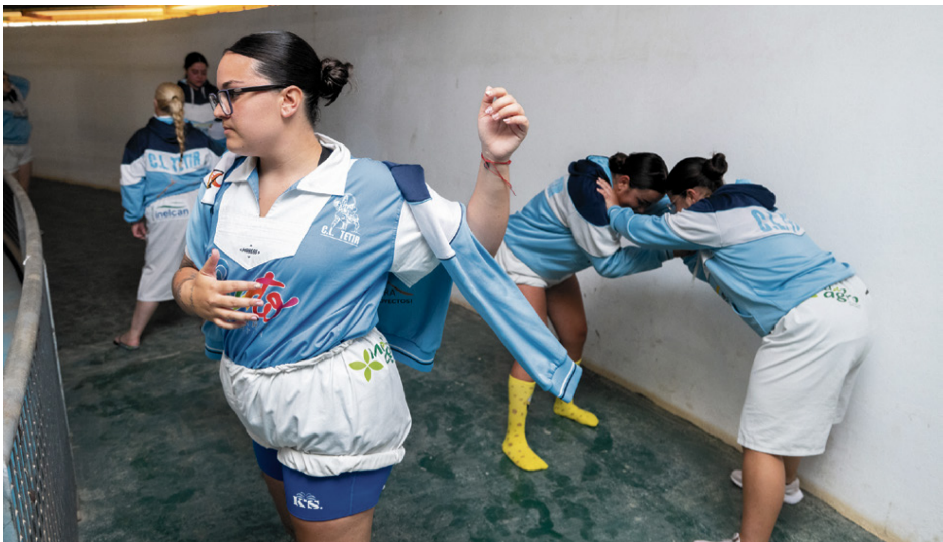
Luchadoras antes de la brega.