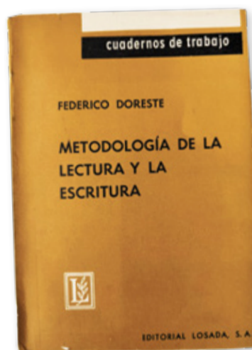
Portada del libro 'Metodología de la lectura y la escritura', publicado por Federico Doreste en 1933.

Cuando Barcelona cayó del lado franquista en 1939, Federico Doreste vivió un doble pro-