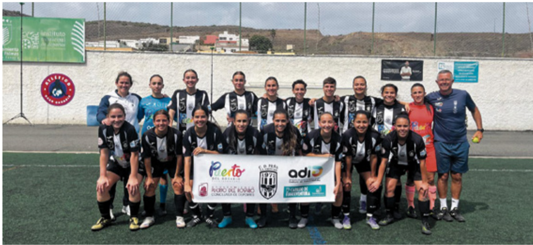
Peña de la Amistad.