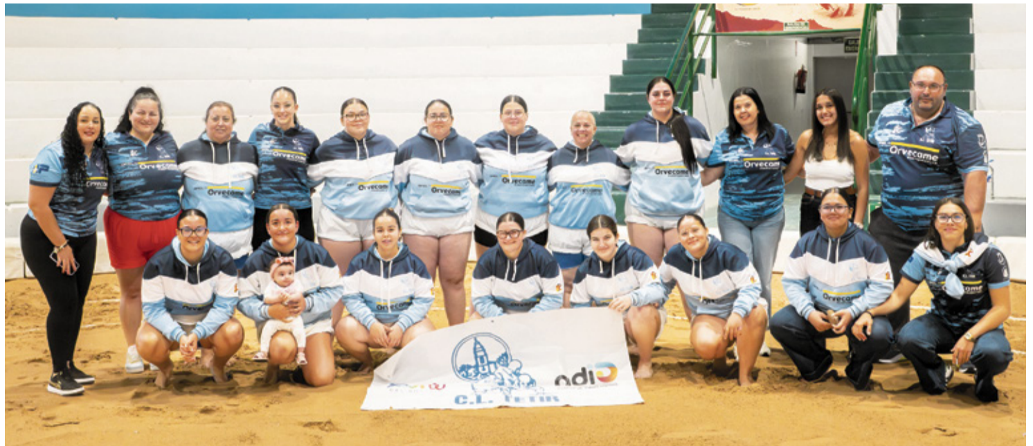
La plantilla del equipo femenino del Unión Tetir.

La realidad es que el equipo, dice la presidenta, depende del masculino, que es el que más ayudas recibe. “Si es cierto que