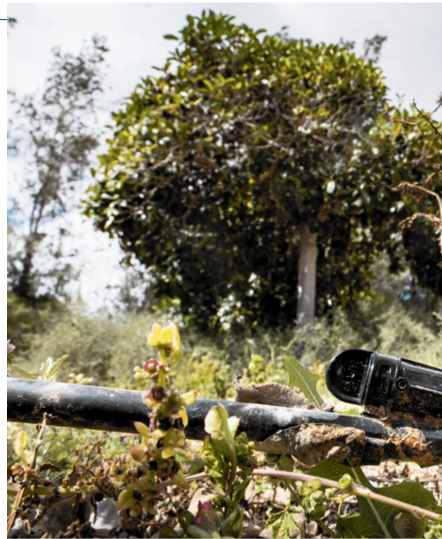
Espacios de riego en zona agrícola.

Por otro lado, el equipo de investigación ha observado en estudios posteriores (hasta el momento, solo realizados en Tenerife) que el origen de la contaminación de las aguas no estaba en las depuradoras, por lo que valoran ahora la hipótesis de que la contaminación se produzca en el flujo o el almacenamiento posterior de las aguas. No obstante, los datos de esta segunda investigación aún no pueden ser validados como concluyentes, o extrapolados de forma generalizada, pues está aún en activo y con un espacio de muestreo determinado. “Todo indica que cuando sale el agua de la depuradora es un agua limpia: para obtener agua regenerada, se pasa por distintos tratamientos y hay un tratamiento terciario al final que mata todos los microorganismos. El caso, ahora, es que desde la depuradora hasta el suelo agrícola hay todo un flujo. El problema, creemos, es probablemente cómo se almacena el agua”, indica, si bien matiza que estos tratamientos terciarios (cloración, UV, ozono) están di-