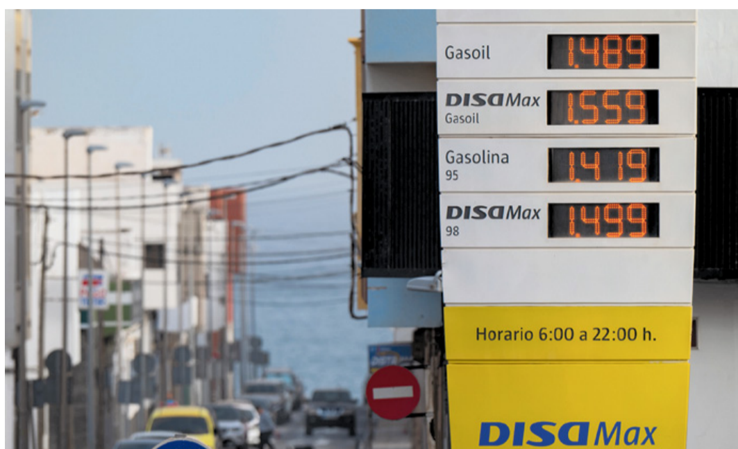
Precios de una gasolinera en Puerto del Rosario a principios de abril.

¿Qué se puede hacer en Canarias para afrontar esta espiral peligrosa? Pues no mucho, pero hay que hacerlo, y hacerlo más allá de las medidas compensatorias que puedan acordarse con el Gobierno de Sánchez, que siempre serán bienvenidas. El primer asalto de este diálogo bilateral se