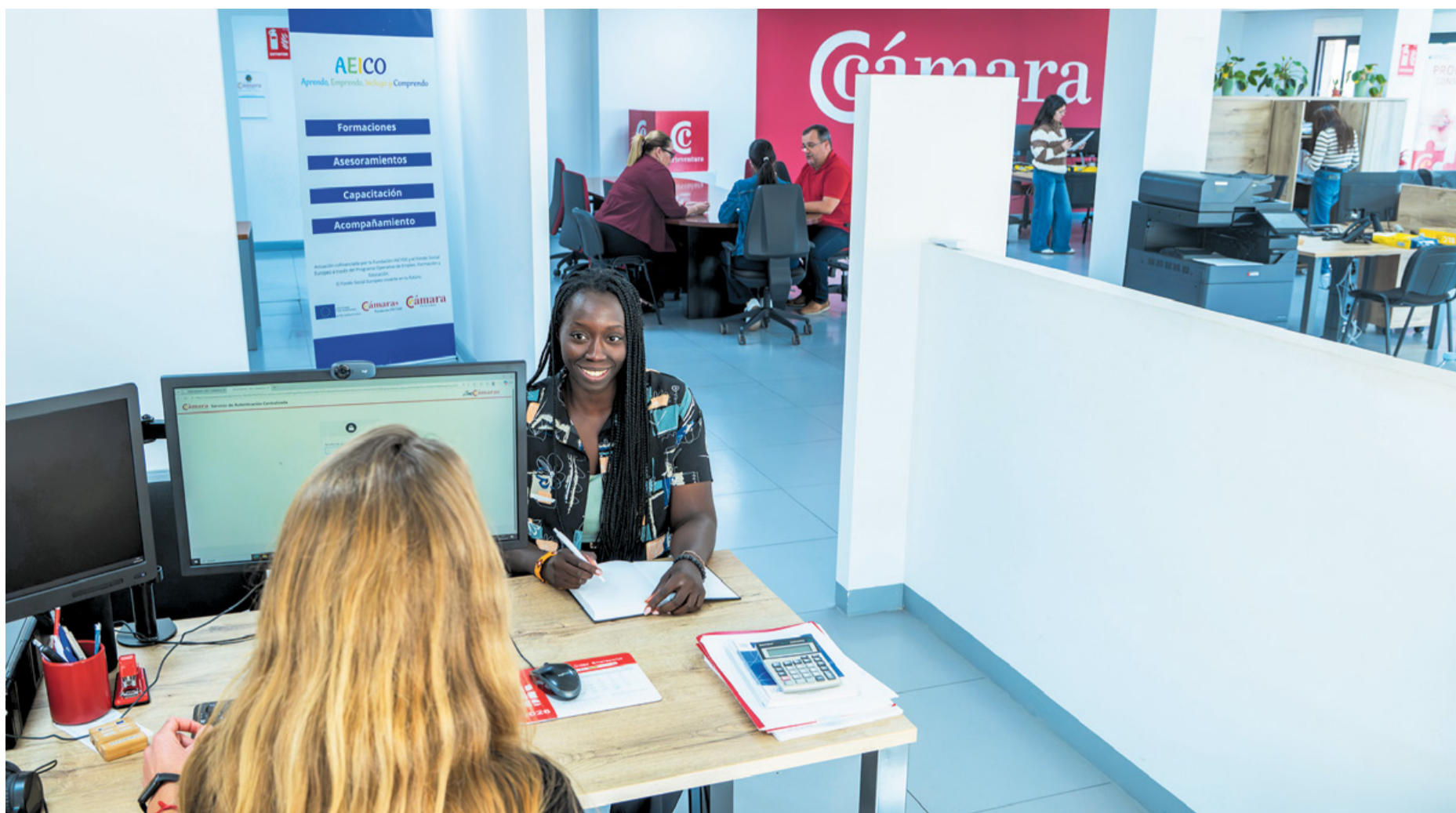
Instalaciones de la Cámara de Comercio en Puerto del Rosario.