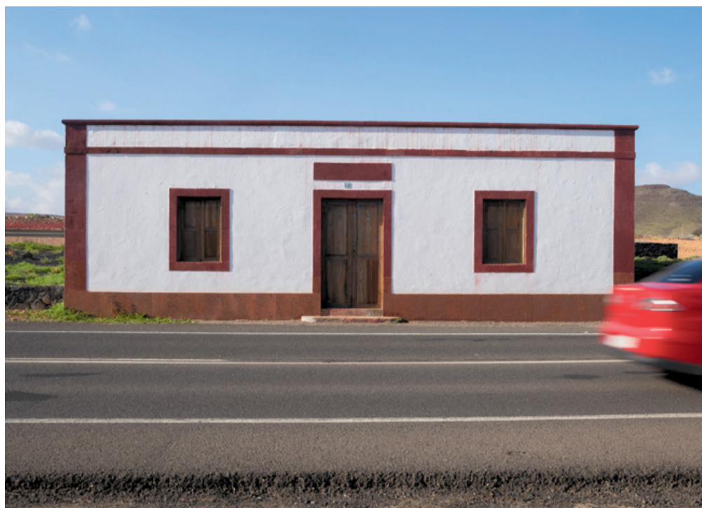
Casa de los Camineros en Zurita.

cación del siglo XVII es anterior a la actual Iglesia de Santa Ana, construida entre 1730 y 1781 en esa localidad.