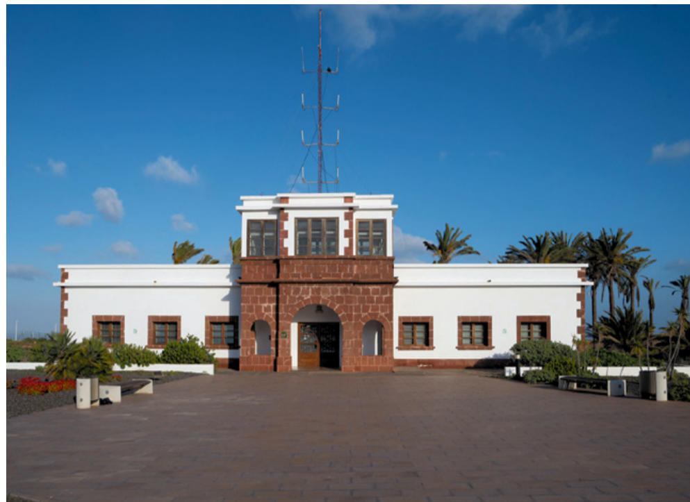
Aeropuerto de Los Estancos.