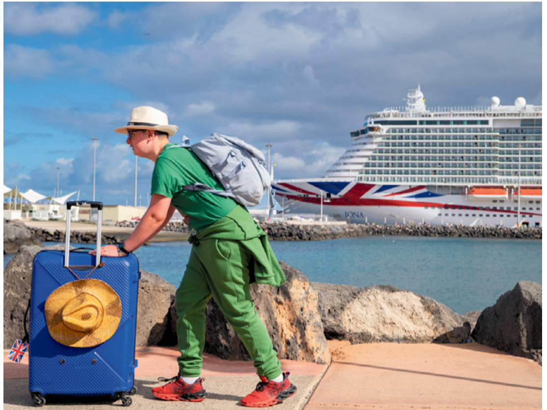
Un turista arrastra su maleta en Puerto del Rosario.

“Canarias es un ecosistema insular frágil y dependiente. Una consecuencia directa, que afectará a la microeconomía, a los bolsillos de las personas residentes, es el encarecimiento de la energía (mayor inflación en el precio de los combustibles) y los insumos en general (la importación)”, explica el académico. “A esto se añade el encarecimiento de los paquetes turísticos y el descenso de la estancia media, reflejado en el número de pernoctaciones. Sin embargo, el sistema turístico canario puede verse beneficiado