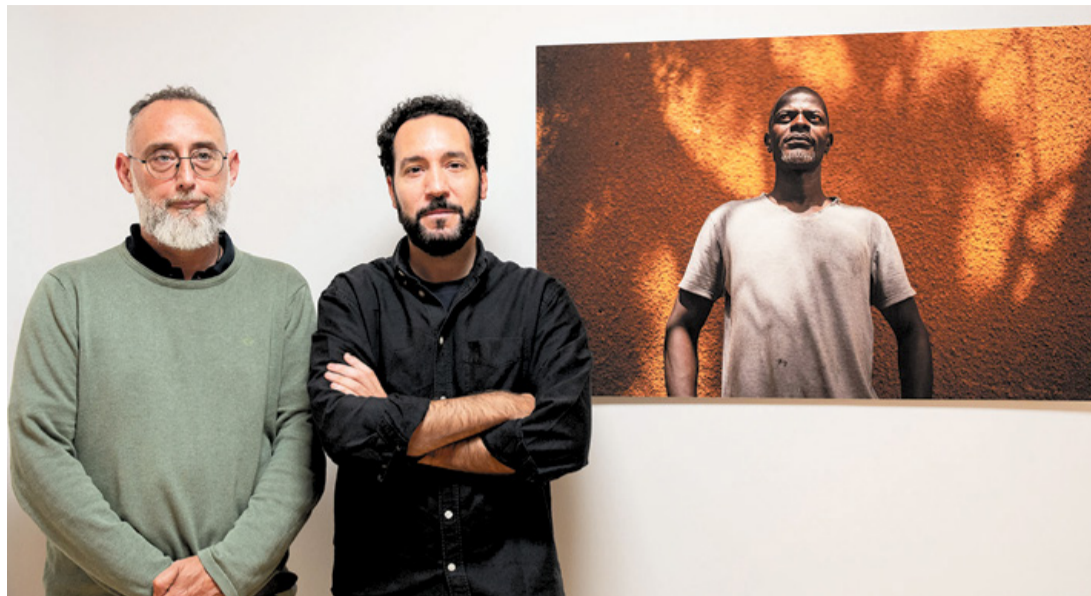
Naranjo y Rod.

En los últimos seis años, ha habido cuatro golpes de Estado en estos tres países. En la actualidad, Níger, Malí y Burkina Faso están gobernados por juntas militares. “La inestabilidad y el deterioro de la situación política anuncian que van a pasar muchas cosas”, vaticina Naranjo que, junto al fotógrafo, regresó en diciembre de 2025 a Ba-