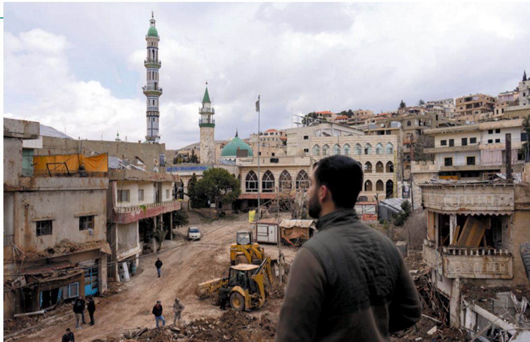
Hussein (nombre ficticio) en una de las viviendas destruidas por las bombas tras los ataques en Nabi Shit, valle de la Bekáa.

Algunos de los ataques israelíes sobre el Líbano han sido precedidos por órdenes de expulsión circunscritas a ciertas zonas o edificios concretos señaladas en rojo en un mapa publicado en redes sociales minutos antes de ser bombardeadas, como ya hicieron en Gaza. Las amenazas y las expulsiones forzadas han llegado a la histórica ciudad de Tiro, cuyos restos ar-