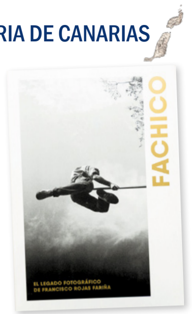
Portada de 'Fachico. El legado fotográfico de Francisco Rojas Fariña'.

El archivo de Rojas Fariña, compuesto por casi 250.000 registros fue donado por su familia al Cabildo de Gran Canaria hace pocos años y la colección se está digitalizando y se está