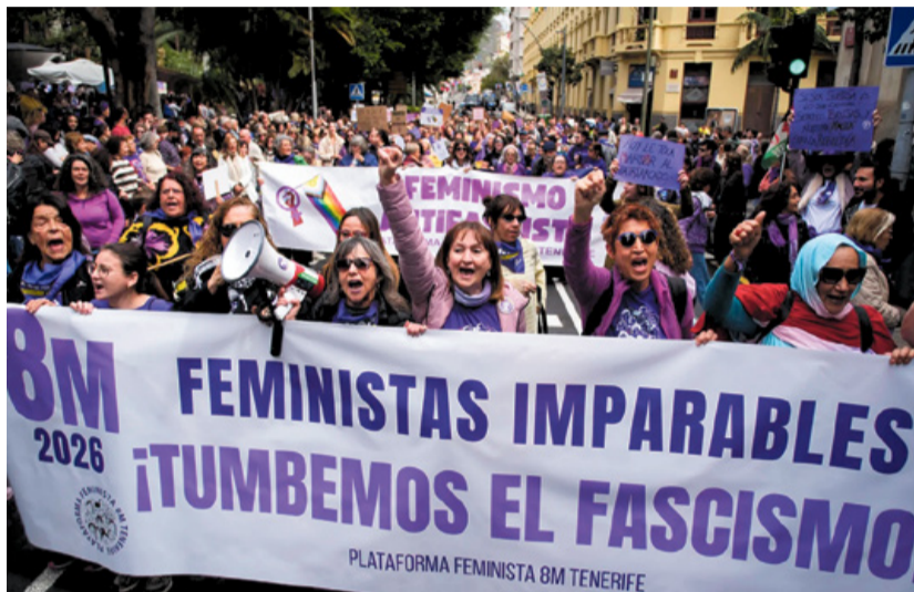
Manifestación por el Día de la Mujer en Santa Cruz de Tenerife.

Al día siguiente, la afonía de cada 9 de marzo, el dolor de cuádriceps de tanto abajo el patriarcado, que va a caer, que va a caer, el audio de la amiga de Gran Canaria que te cuenta cómo se vivió allí, y las risas en el grupo de la Red Feminista de Fuerteventura porque la machosfera arde en Facebook. Capturamos algunos “tontas de manual” o “estas pelosobacos” y nos reímos, nos reímos mucho. Llega la foto de un hombre en la manifestación, sosteniendo un cartel que dice “Mujeres, ¡¡por favoor!! tomad el control de la Humanidad”, y nos reímos más. Ojalá las mismas