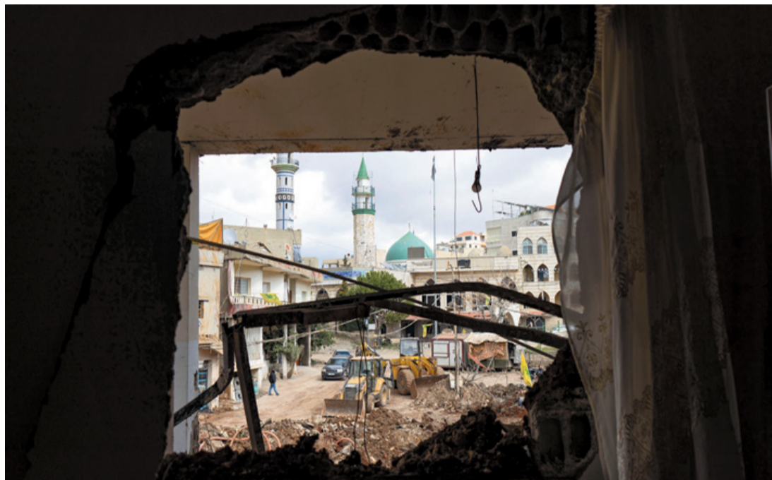
Destrucción de Kfar Kila, pueblo del sur del Líbano.

queológicos fenicios, romanos y bizantinos son Patrimonio de la Humanidad de la Unesco.