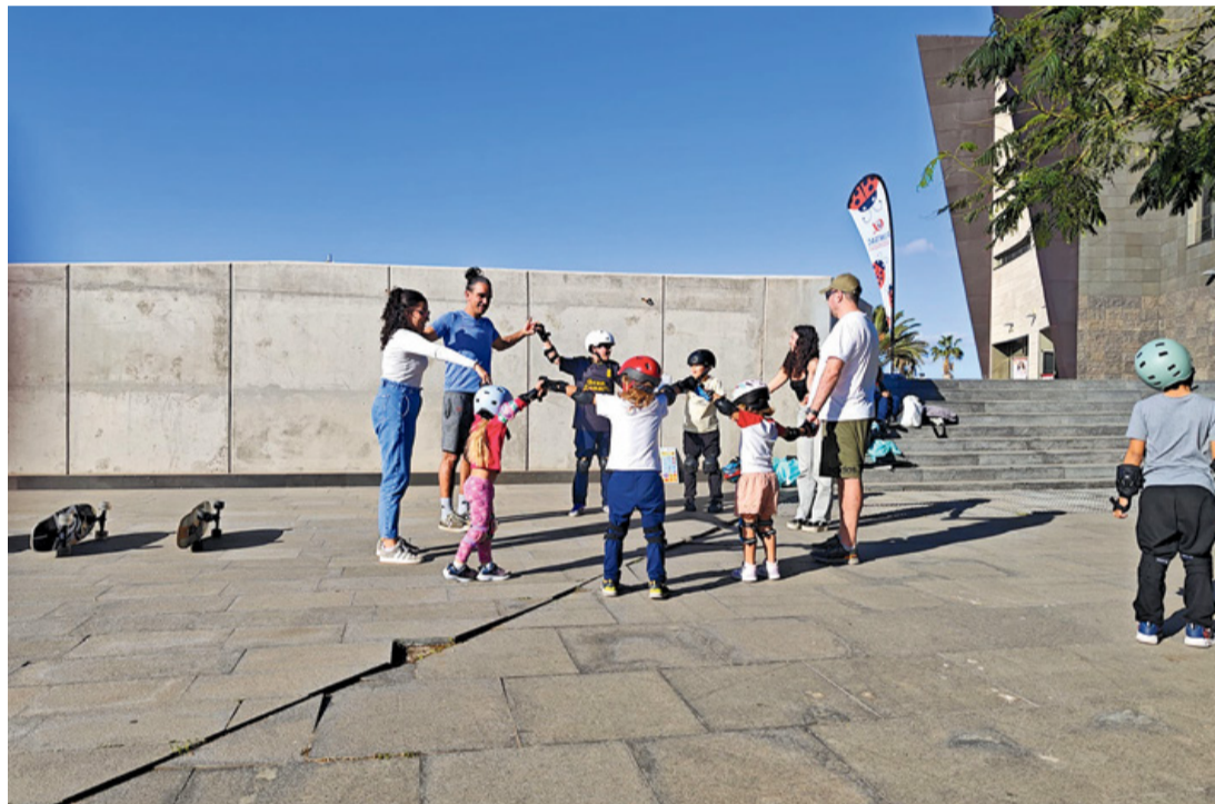
Los jóvenes se preparan para una tarde de skate.

Asimismo, la fundación ha firmado recientemente un convenio con el Ayuntamiento de Puerto del Rosario para que los menores puedan disfrutar de una actividad acuática. “Todos los días van a la piscina de Macrofit, sin que tengan que pagar