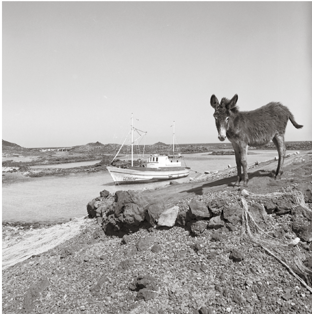
Isla de Lobos en los años sesenta.

En las siguientes décadas su producción siguió en aumento y entre los galardones conseguidos destacó el primer Premio del concurso mundial organiza-