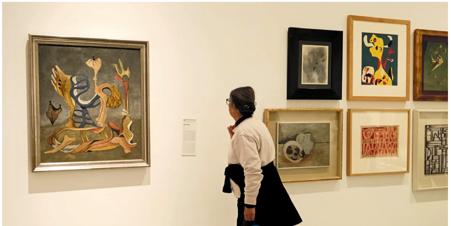
La obra 'Amor hasta los huesos' comparte sala en el Reina Sofía con Óscar Domínguez, Maruja Mallo, Dalí y Miró, entre otros.

Cruzas una esquina y de pronto te acercas a la cartela y lees que se trata de una escultura que hizo Pablo Picasso, y más allá, ves a la mujer que se asoma al balcón y recuerdas que es un Dalí. Y así, en este mundo de veredas, colores y pinturas que a veces solo puedes ver en libros y enciclopedias, llegas hasta ese Amor hasta los huesos , la tercera de las obras de Juan Ismael que el Museo Reina Sofía adquirió hace diez años, y que costó 16.000 euros.