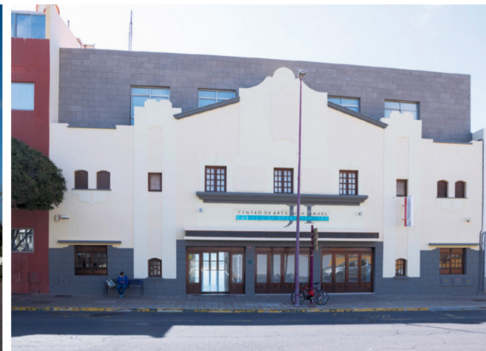
Antiguo Cine Marga, hoy Centro de Arte Juan Ismael.