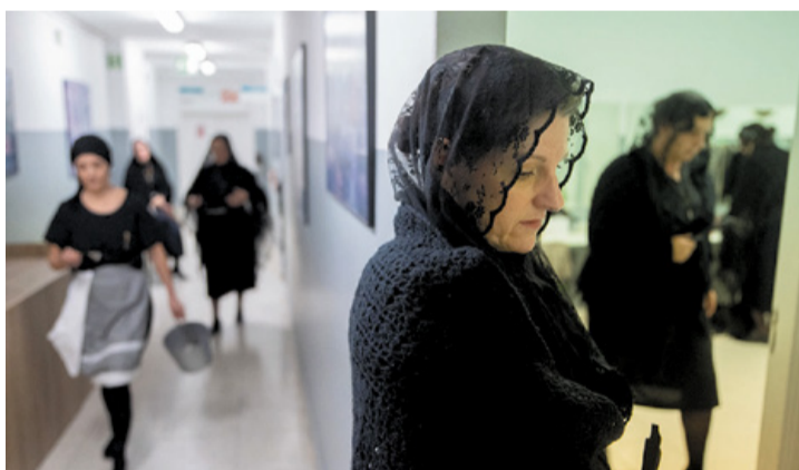
Algunas componentes de La Tartana, minutos antes de salir al escenario.

El grupo teatral majorero se estrena con ‘La Casa de Bernarda Alba’, con un lleno absoluto del Auditorio Insular