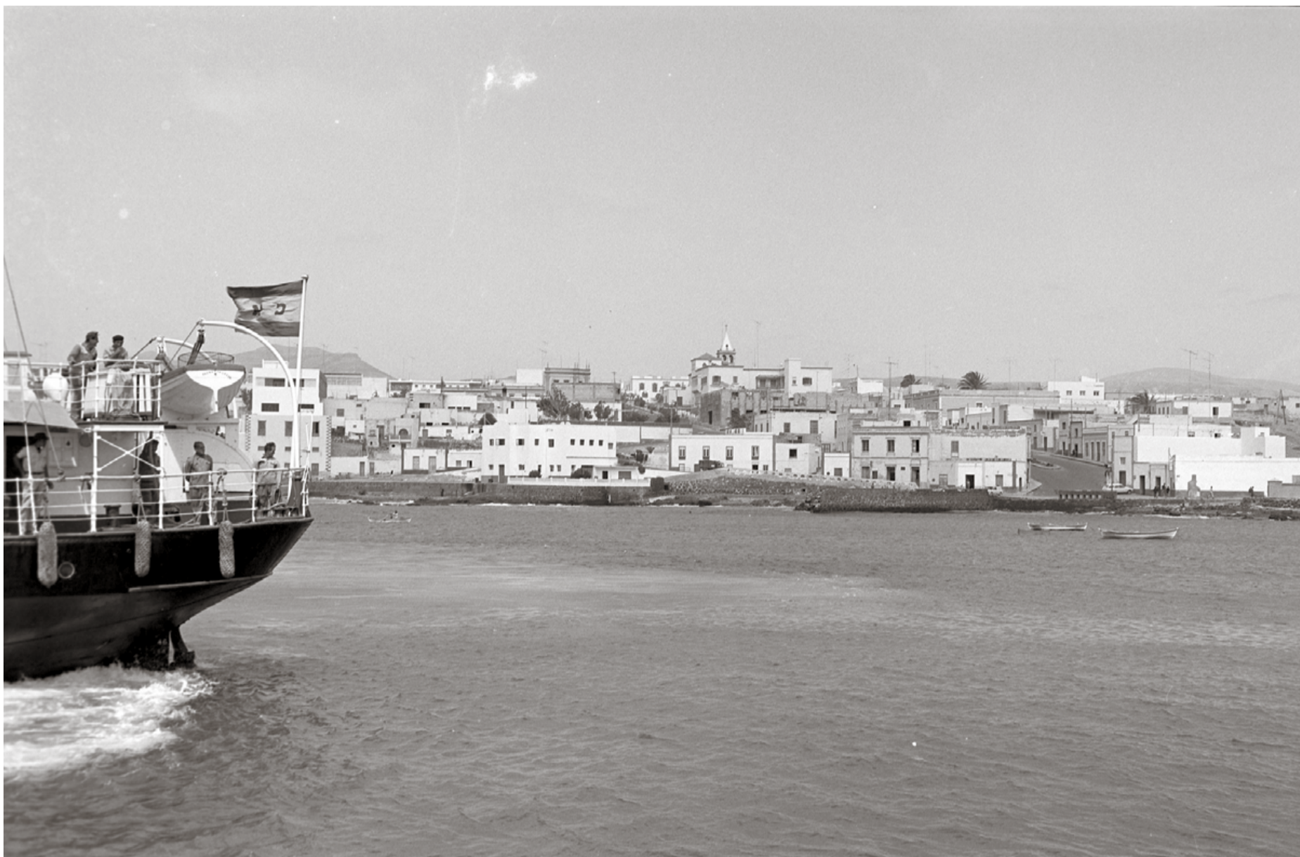
Frente marítimo de Puerto del Rosario en los años sesenta.