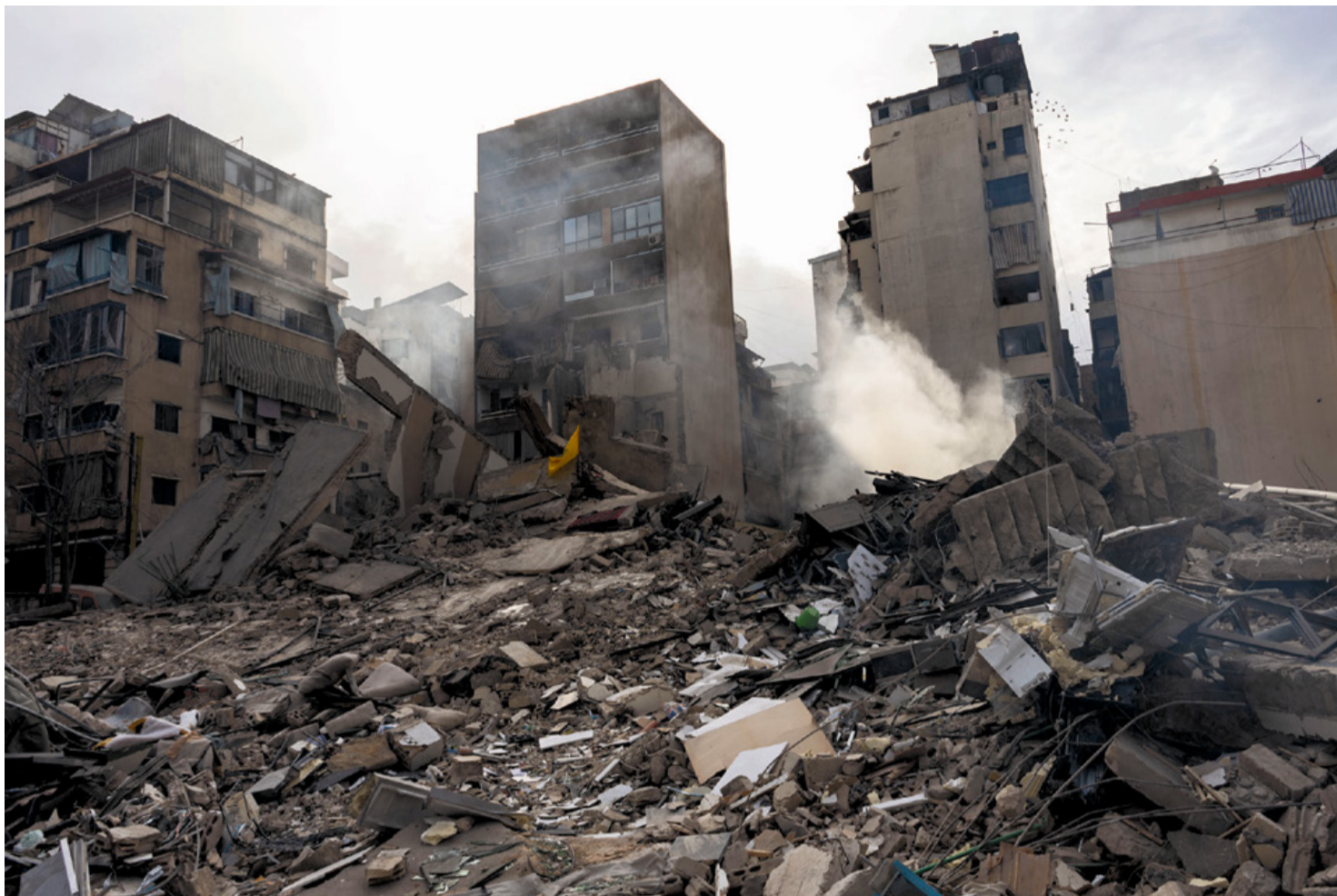
Restos del edificio bombardeado por Israel en el céntrico barrio beirutí de Bashoura (Beirut) el pasado 18 de marzo.