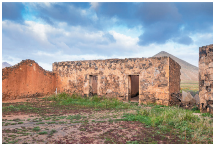
El artista nació en una de las dependencias de la Casa.