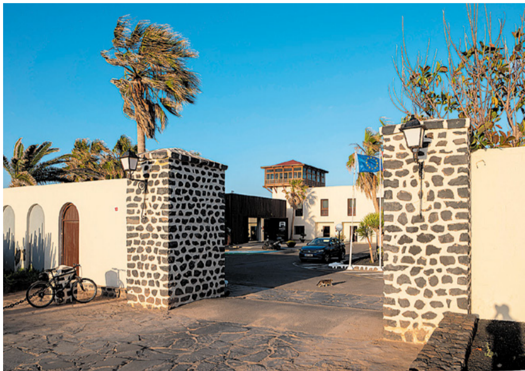
Antiguo Parador de Turismo.