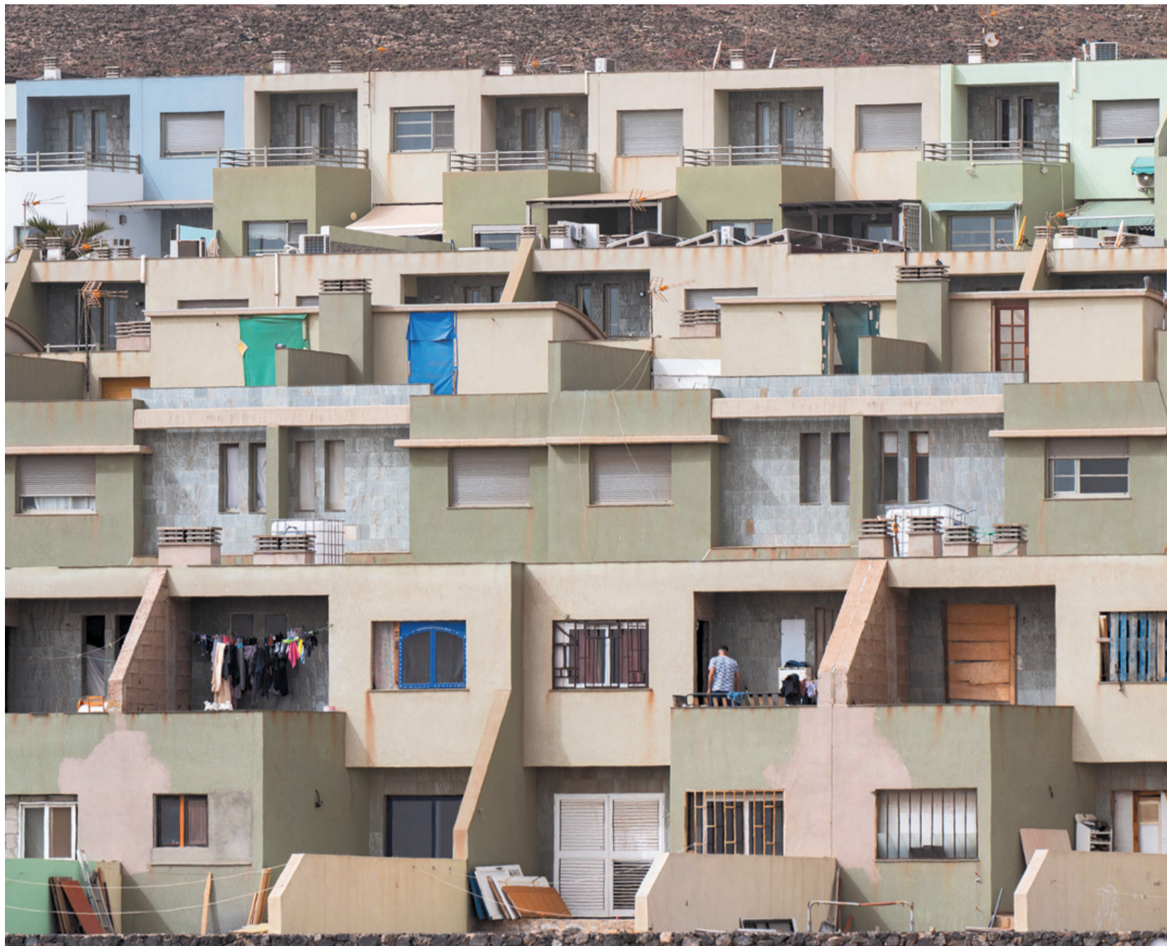
Viviendas sin terminar en la urbanización Playa Blanca, en Puerto de Rosario.

La mayor parte de los usuarios de Entre Mares, en torno al 70 por ciento del total, residen en el municipio capitalino. Desde que la asociación echó a andar en 2014 han sido reitera-