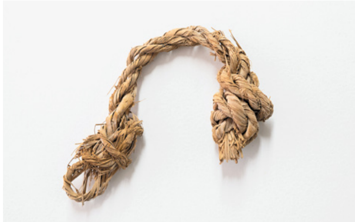
Cuerdas de la cueva de Maninubre.

El proyecto también incluye el estudio de nueve cuerdas halladas en la cueva de Maninubre, en el municipio de Antigua. María explica que se trata de cordeles, en su mayoría hechos