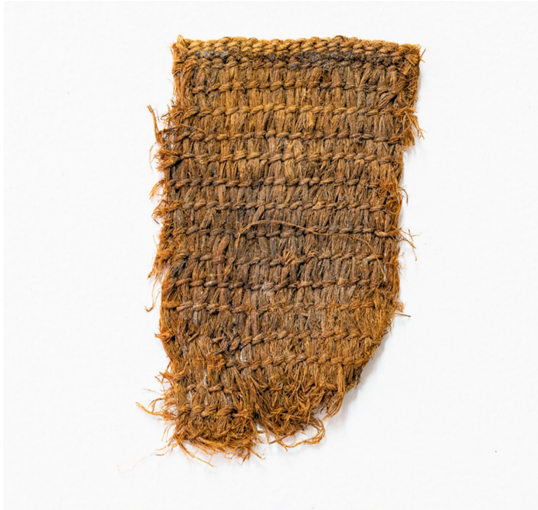
El tejido, de nueve centímetros.

Los estudios relacionados con cestería y cordelería en época prehistórica en las Islas se limitaban a las investigaciones rea-