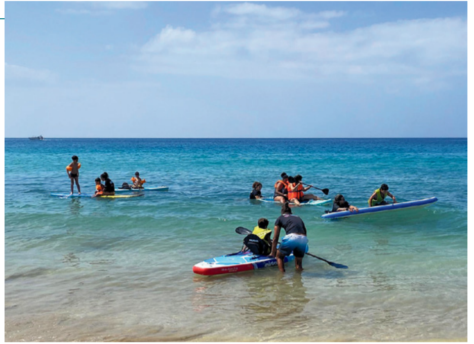
Actividades acuáticas con menores.

Forma parte de las acciones a desarrollar para dar mayor visibilidad a las neurodivergencias. “La idea es celebrar la diversidad y la inclusión”, especifican desde la fundación. El recorrido concluirá en la Plaza de la Paz con un concierto del Grupo Bomba en el que se estrenará el himno de Funteac.