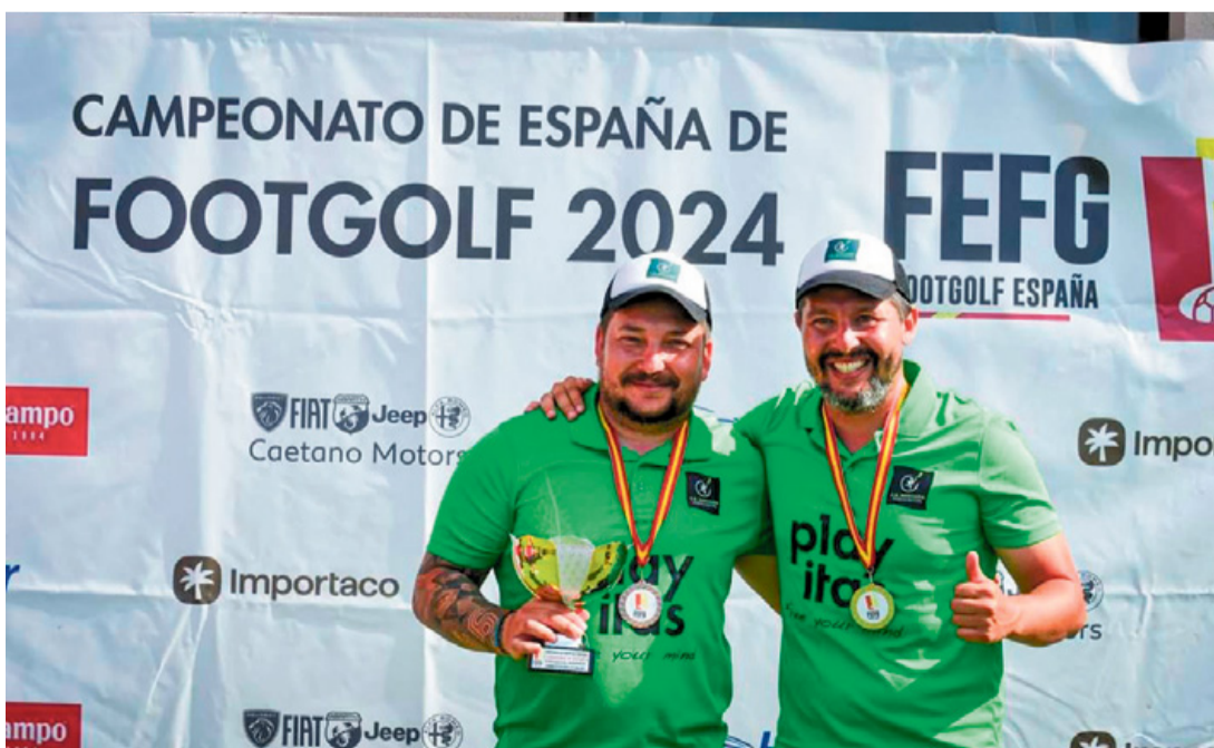
Los dos hermanos Padilla.

“El objetivo es meter el balón en un hoyo de golf adaptado y hacer 18 hoyos”