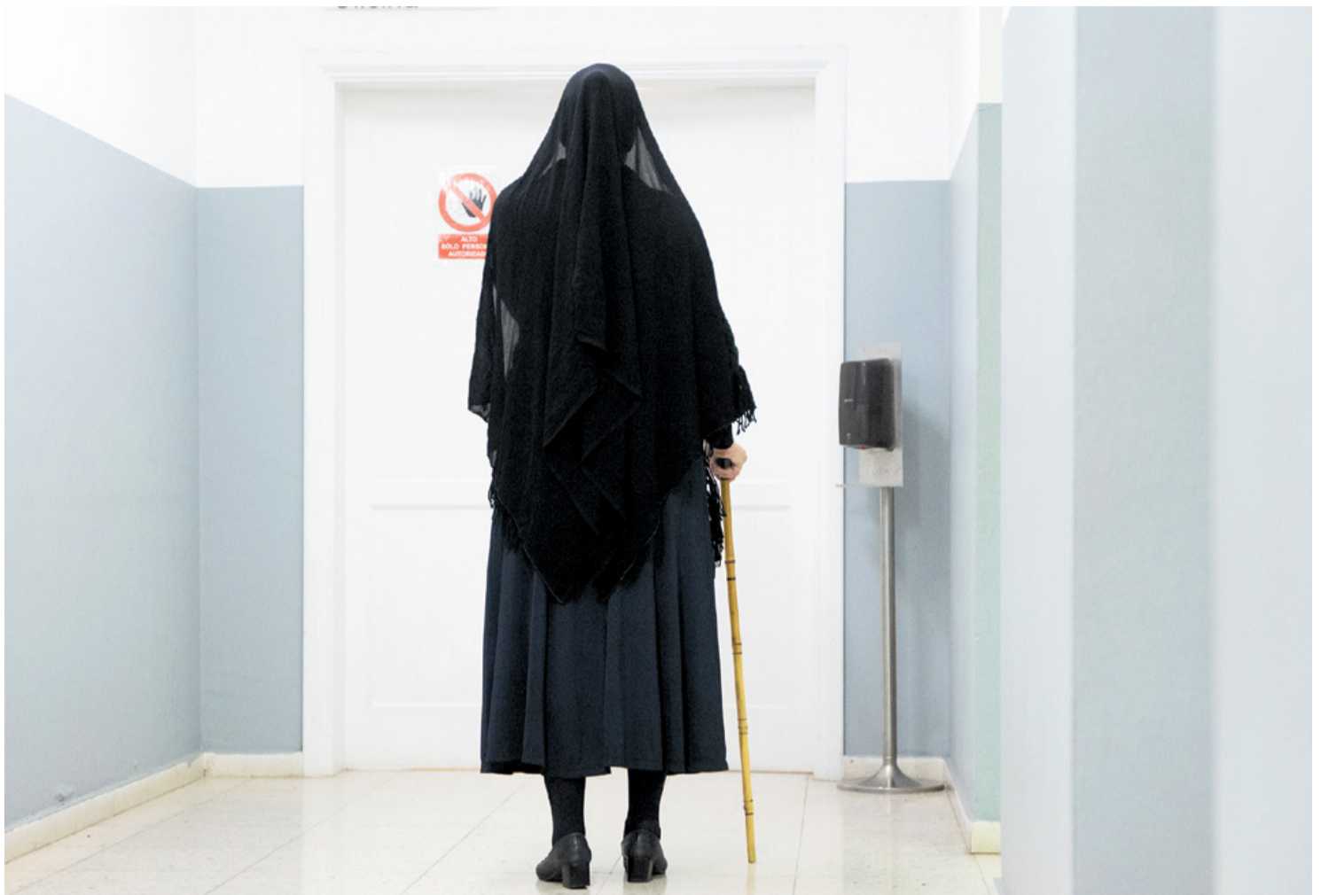
Bernarda Alba, antes de salir a escena.

Es 27 de marzo, la noche que siguió al Día Mundial del Teatro. Es también la primera salida al escenario de La Tartana, un grupo teatral que acaba de nacer y que en su primera función ya consiguió un lleno completo de butacas: más de 400