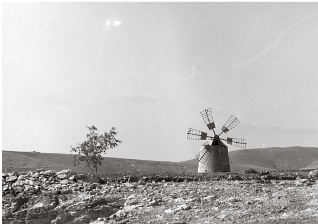
Molino de Fuerteventura en los años sesenta.