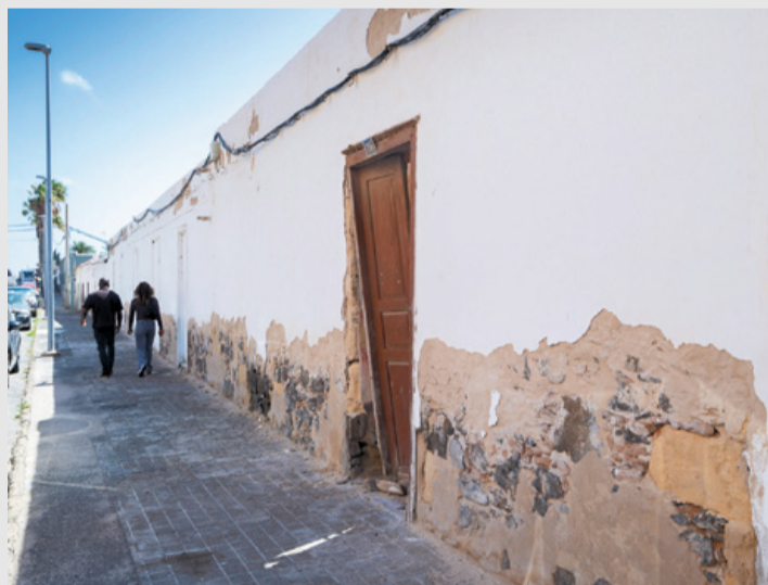
Números 16, 18 y 20 de la calle Juan Domínguez Peña.

La empresa propietaria, El Aceitún SL, acudió a los tribunales tras dictarse la medida cautelar que suspendió la licencia de derribo de los números 16, 18 y 20 de la calle Juan Domínguez Peña,