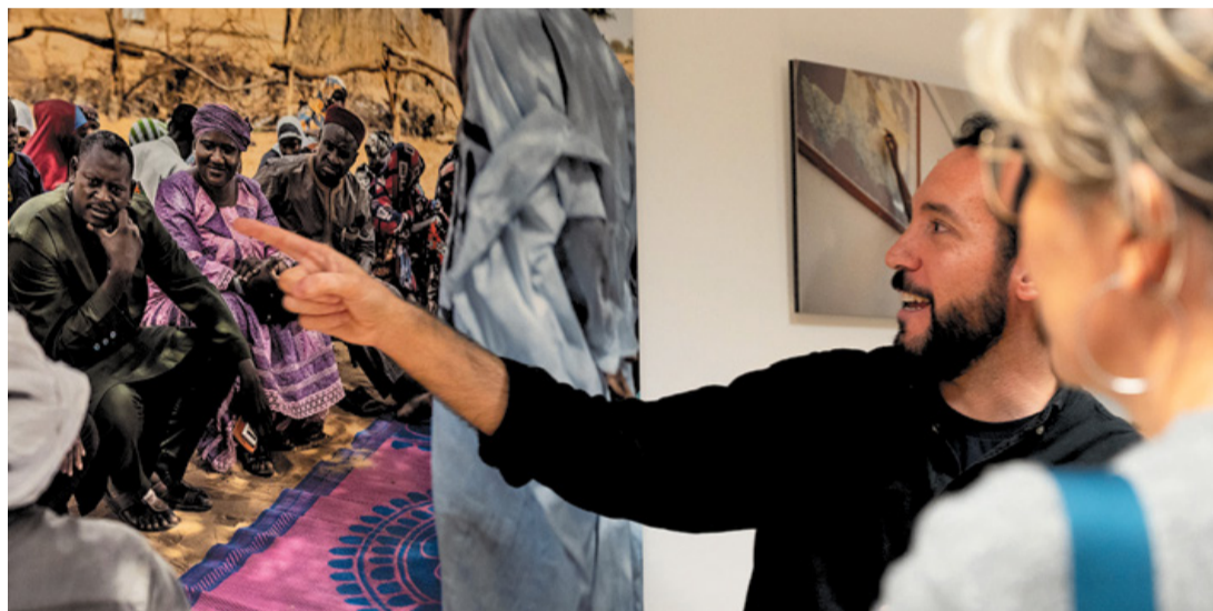
El fotógrafo, en la inauguración de la muestra.

mako, la capital de Malí, para reportear y seguir contando lo que está ocurriendo en este conflicto cercano geográficamente a Canarias.