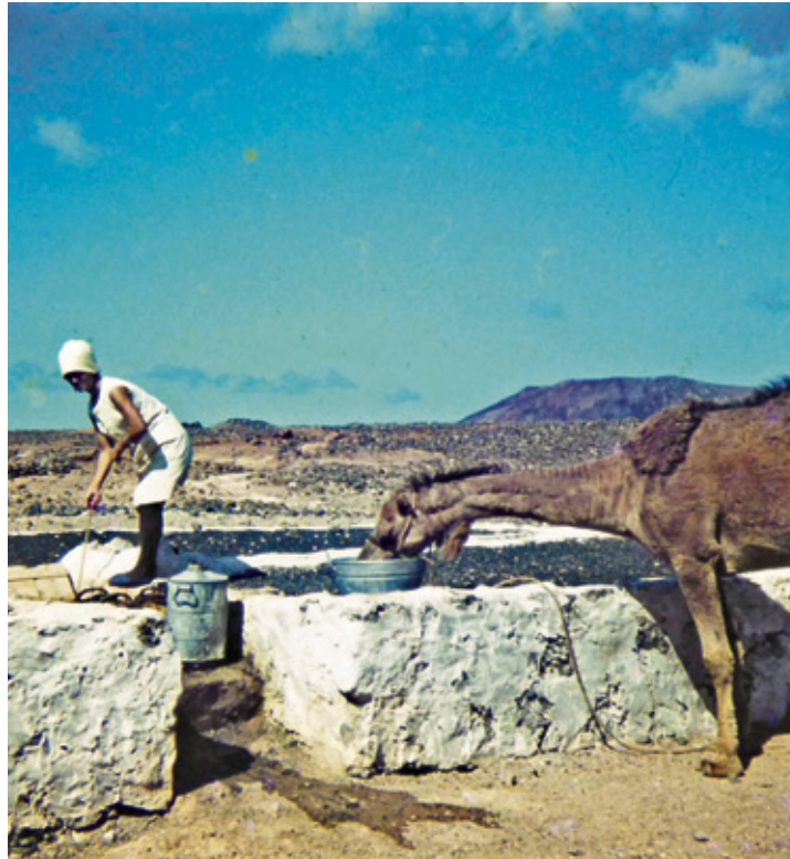
Mujer guindando agua de un aljibe en Playa Blanca para dar de beber a un camello.

De la misma manera, para barruntar la llegada de lluvia