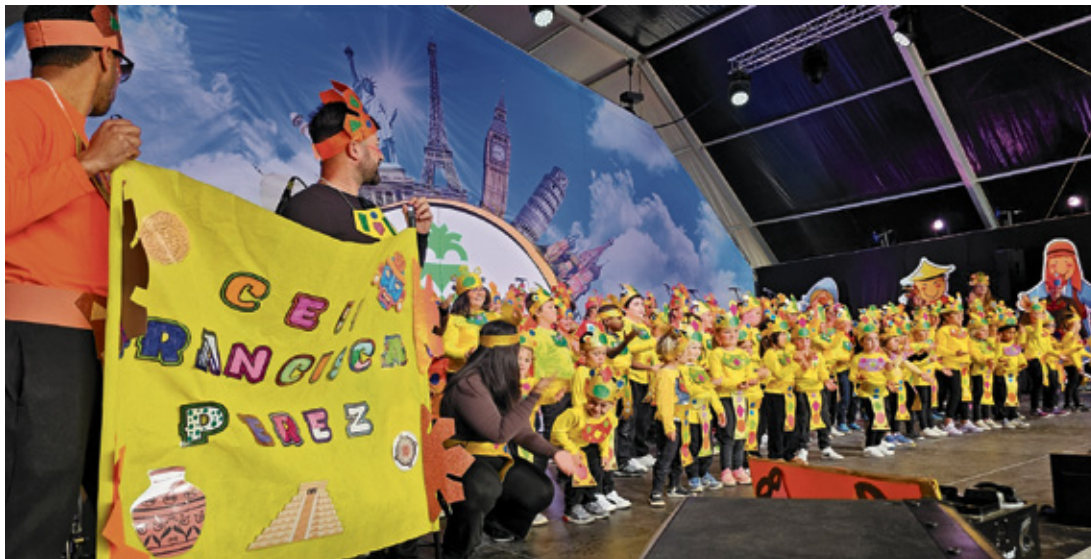
Pasacalles y actuaciones infantiles en el Carnaval de Antigua. Fotos cedidas.

El Carnaval capitalino viene cargado de humor y crítica con la reaparición de Las Zarandajas, Revolucionadas y Quintillos, y Tictactitos cumple 20 años