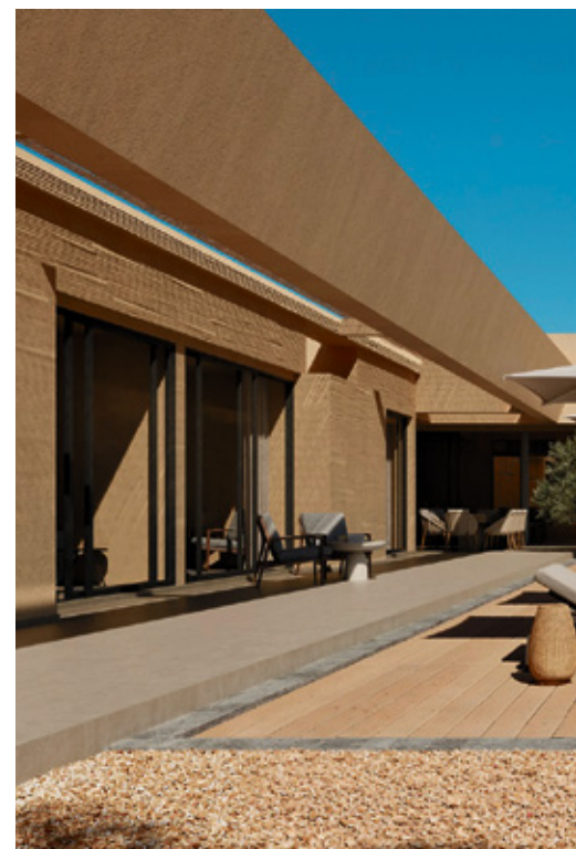
Villa Morro Francisco.

-¿Qué le motivó a expandir su actividad profesional desde Tenerife hacia Fuerteventura? En especial, ¿qué le atrajo de Corralejo como lugar para desarrollar nuevas promociones?