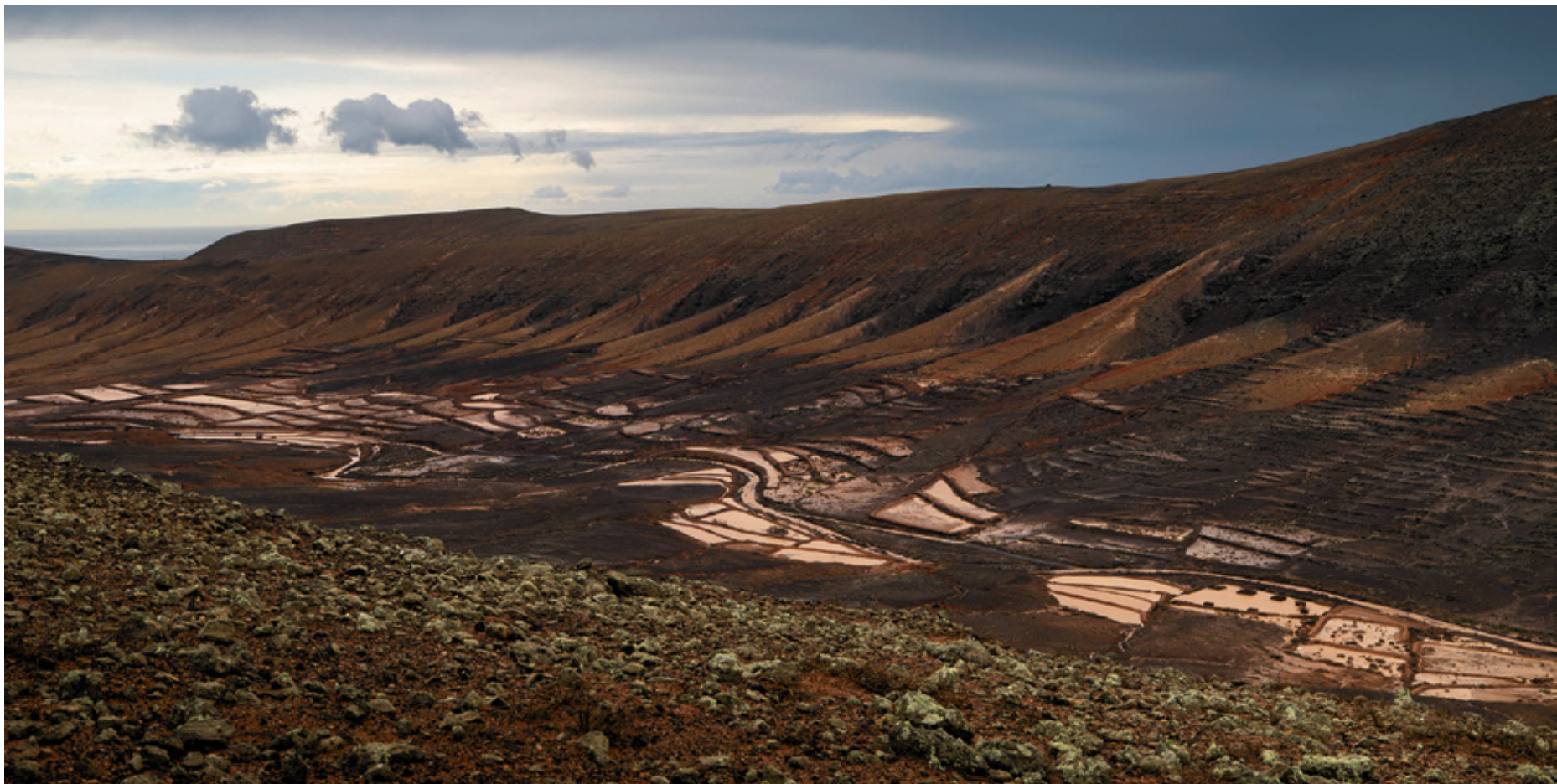
Gavias en Vallebrón.