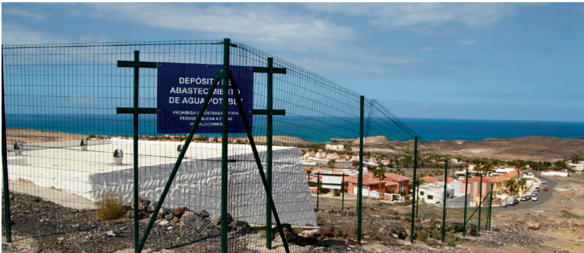
Depósito de agua de La Pared.