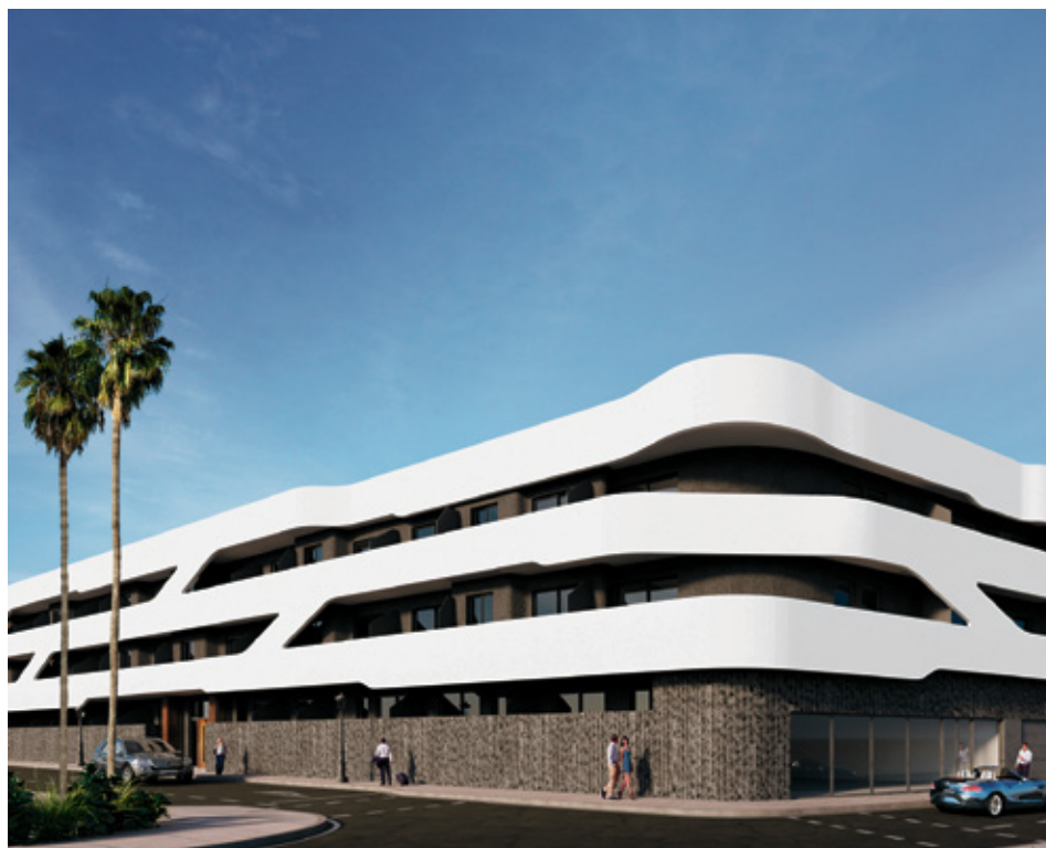
Edificio Arthe Corralejo.

celosías que dibujan sombras cambiantes en el suelo, aperturas que rasgan la pared para que un rayo de sol ilumine un rincón concreto a una hora precisa, y reflejos de agua que proyectan destellos en los techos. Y tenemos en cuenta un espacio fluido: desdibujamos los límites entre dentro y fuera. No construimos ‘cajas con ventanas’, sino membranas permeables que invitan al paisaje a entrar y permiten a la vida expandirse hacia él. Es un estilo que prioriza la sensación de libertad y conexión. En esencia, nuestro estilo propio es la ausencia de capricho y la presencia de sentido. Es la búsqueda constante de una belleza serena, atemporal y profundamente ligada a su lugar. No diseñamos edificios, diseñamos hábitats para una vida plena en un contexto único.