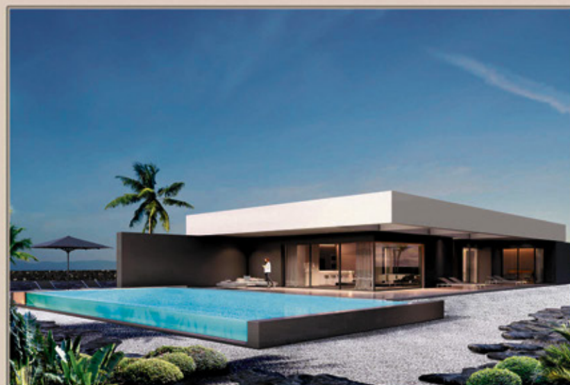
LAJARES VILLA 2

TFNO: 922 27 94 12 teotimo@teotimoarquitecto.com