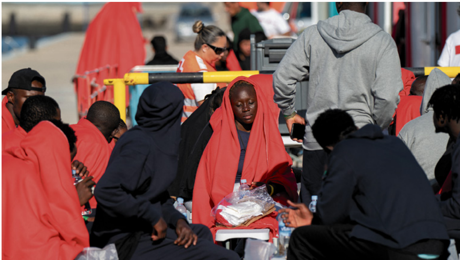
Se calcula que medio millón de personas se podrán acoger a la medida.

Las asociaciones aplauden la medida, pero temen la falta de recursos para atender los expedientes de la flexibilización del Reglamento de Extranjería