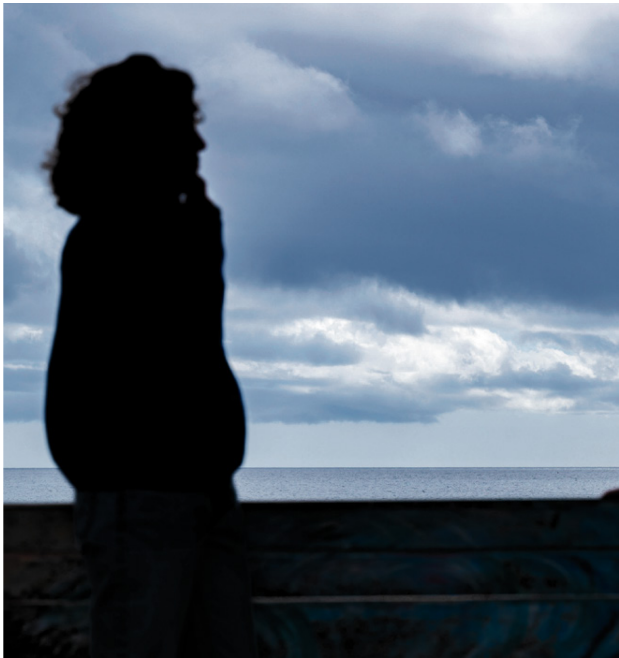
Trabajadoras sociales de Oblatas Canarias en Fuerteventura.

Se centran en Puerto del Rosario, porque es “donde mayor número de mujeres solemos en-