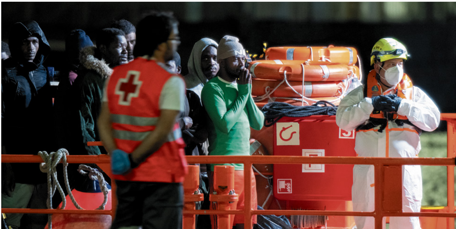
Migrantes recién llegados a Fuerteventura.