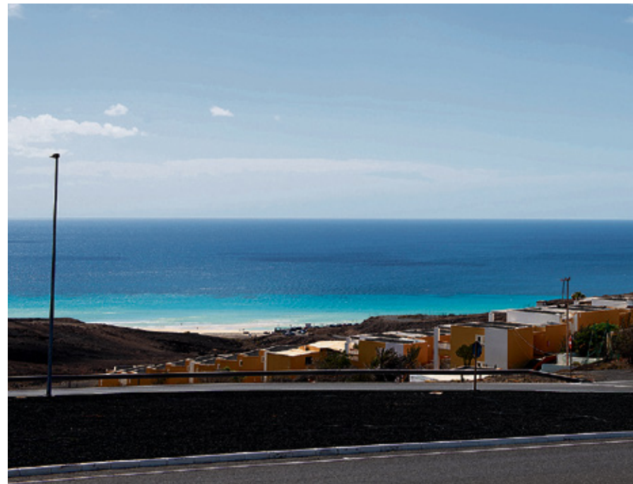
Urbanización Tierra Dorada, en el municipio de Pájara.

En el año 2009, el Gobierno de Canarias aprobó la Ley de Medidas Urgentes cuyo artículo 17 trataba sobre las alternativas a los aprovechamientos urbanísticos de uso turístico y decía que los suelos urbanos de uso turístico, así como los urbanizables sectorizados y ordenados con destino total o parcialmente turístico que no hubieran quedado desclasificados por las Directrices del Turismo de 2003 y que siguieran sin edificar con motivo de la Moratoria turística, pero que mantuvieran sus derechos urbanísticos consolidados,