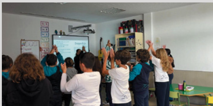
Escuela de Carnaval de La Oliva.