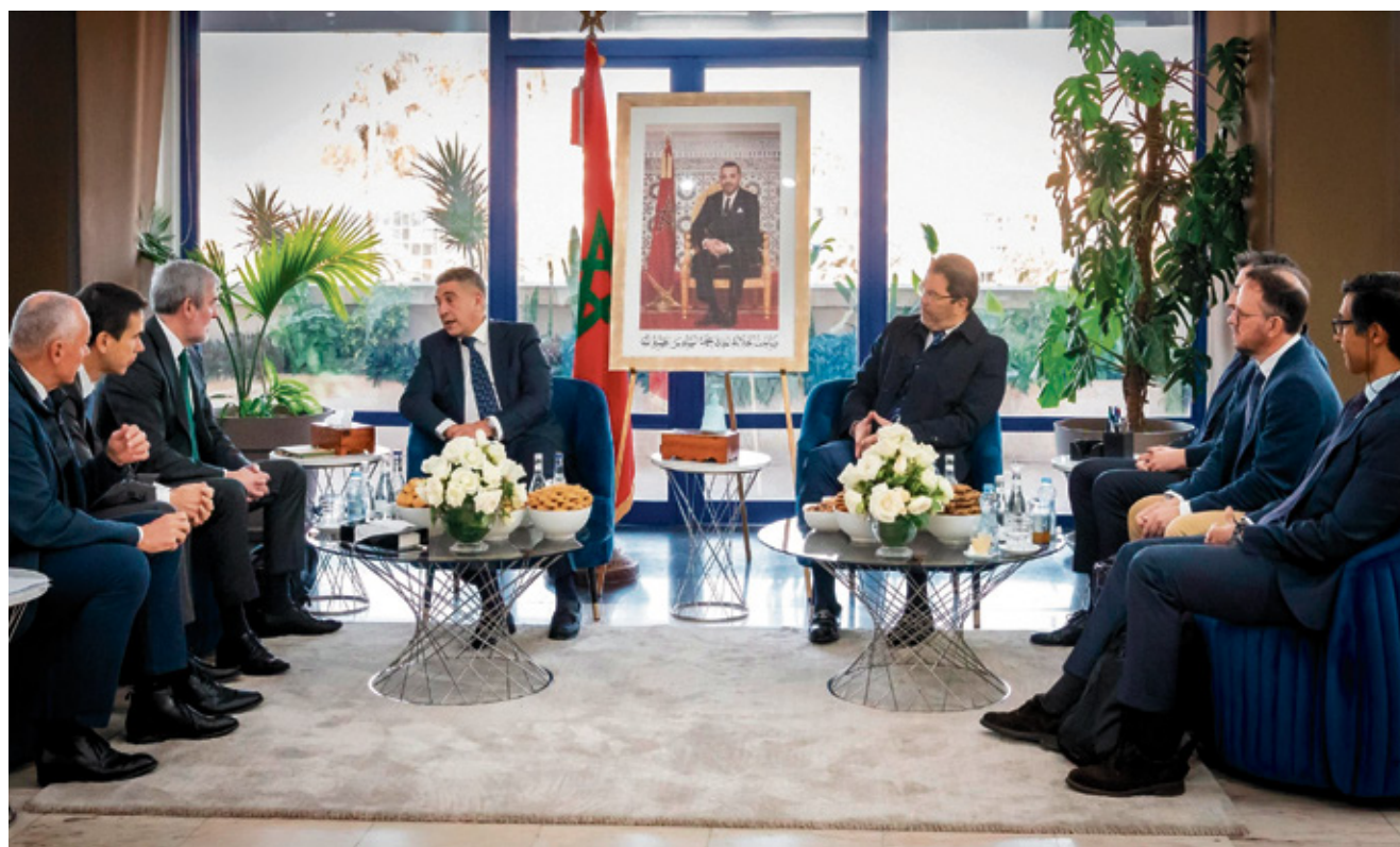
Delegación del Gobierno de Canarias en su visita oficial a Marruecos.

No obstante, y en lo tocante al viaje de la delegación canaria, quizá este ambicioso esfuerzo nos sir-