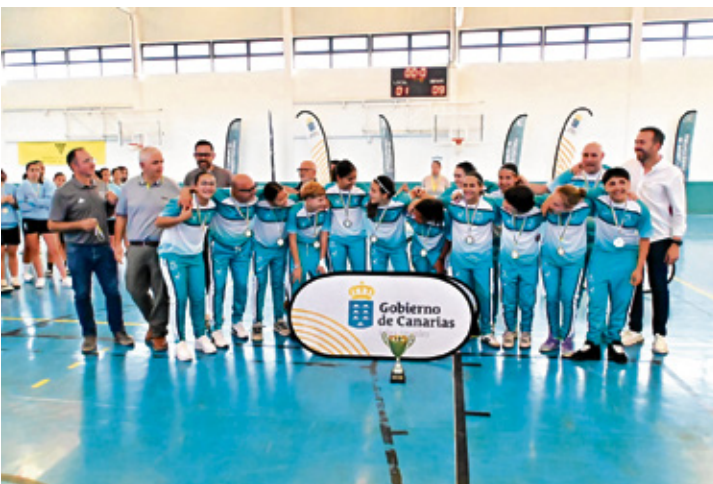
Selecciones de Fuerteventura en el Campeonato de Canarias en Edad Escolar.

presó su agradecimiento “al Gobierno de Canarias y al Cabildo de Fuerteventura por apostar por este tipo de iniciativas, sin cuya ayuda no hubiera sido posible la organización de dos competiciones que se han desa-