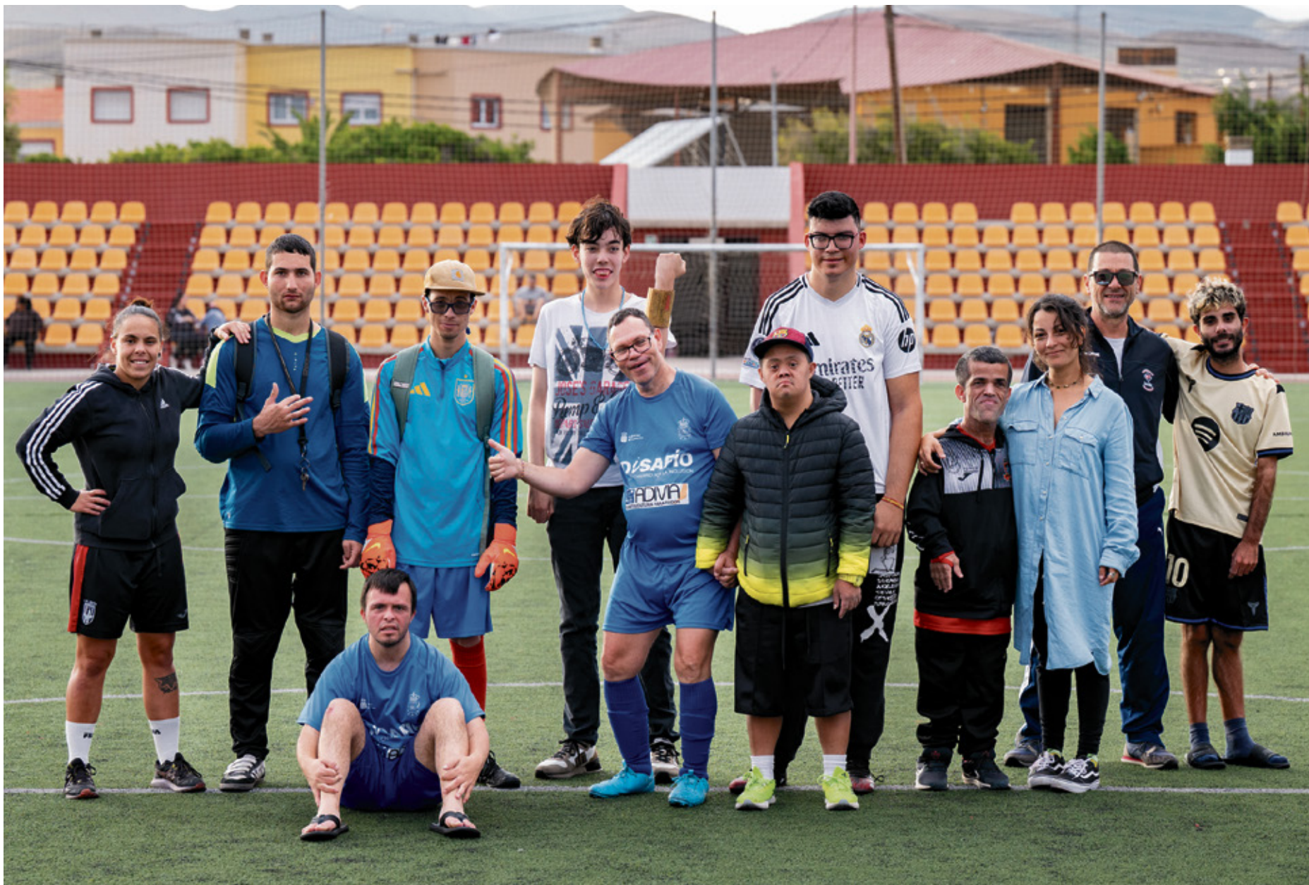
Algunos componentes del equipo FuerteAdivia, tras un entrenamiento.