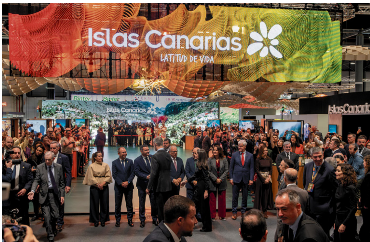
El 'stand' de Canarias sigue despertando gran interés.

Solo había que acercarse al 'stand' de Fuerteventura en la Feria Internacional de Turismo (FITUR) en Madrid y entonces alguno de esos visitantes preguntaba: ¿Y en esa isla vive gente? Y en el de Lanzarote, alguien quiere saber si hay aeropuerto en La Graciosa. Para disfrutar tanto como hizo la sobrina de la Pantoja.