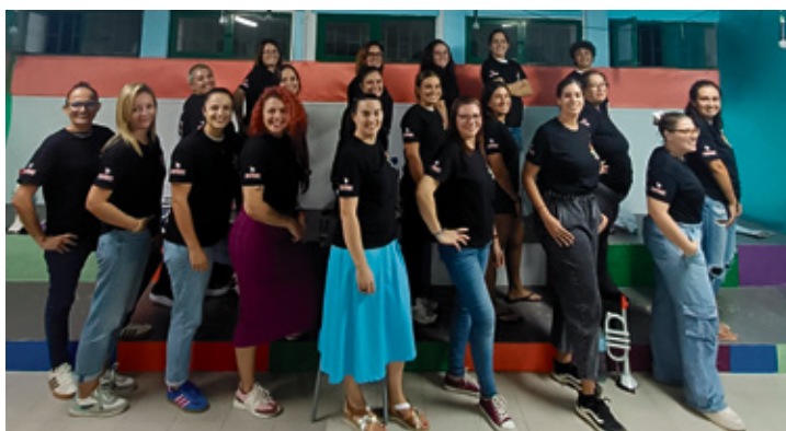
Ensayo de la murga Las Zarandajas.

fantil Tictactitos, que cumple 20 años de ilusiones en el carnaval mayorero. El día 11 toca el turno al barrio de Fabelo, las 90 viviendas y Los Pozos, con Los Gambusinos, Gambusitos, la comparsa Grimanesa, Malvasía y la batucada Bloco Da Ilha. El día 18, los talleres llegan