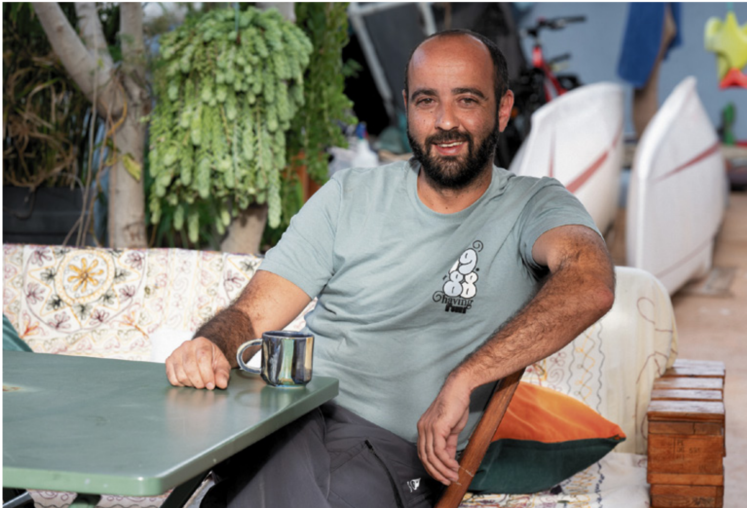
El cineasta Himar Soto, en su casa.

“Esa falsa verdad es precisamente lo que quiero transmitir con Ciclo . Los algoritmos fomentan visualizaciones de vidas idealizadas porque gustan a los demás y eso mismo hace que se