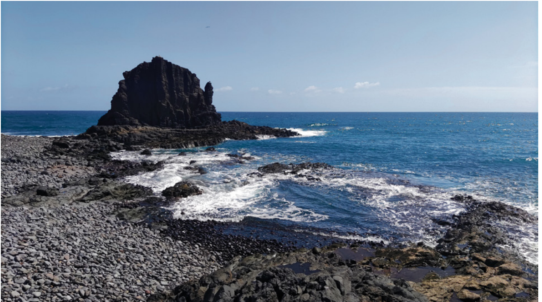
El Roque, donde la tradición asegura que Simeón quiso volar.