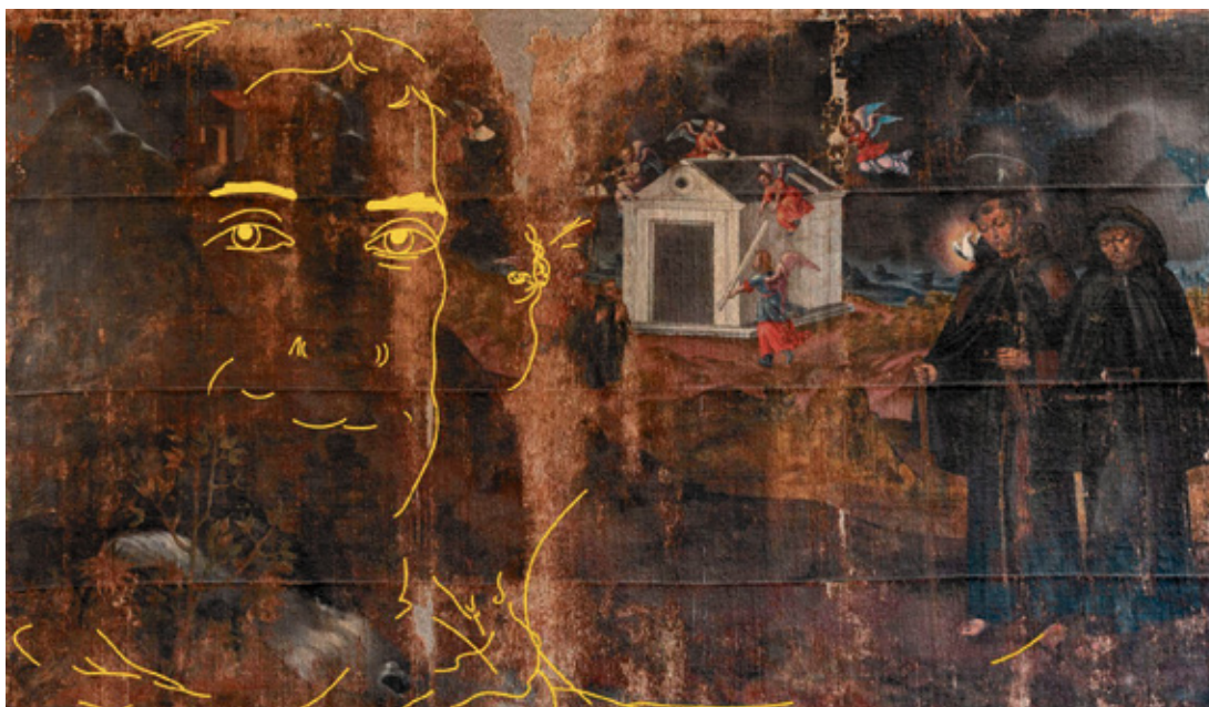
Detalle del estudio sobre el cuadro de La Ampuyenta.

El cuadro fue pintado en la primera mitad del XVIII, el rostro podría ser anterior