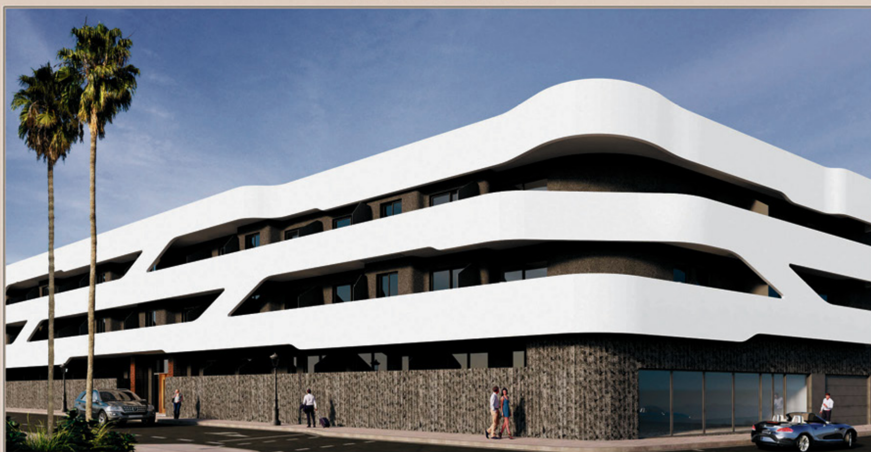
CORRALEJO VIVIENDAS - GARAJES Y TRASTEROS