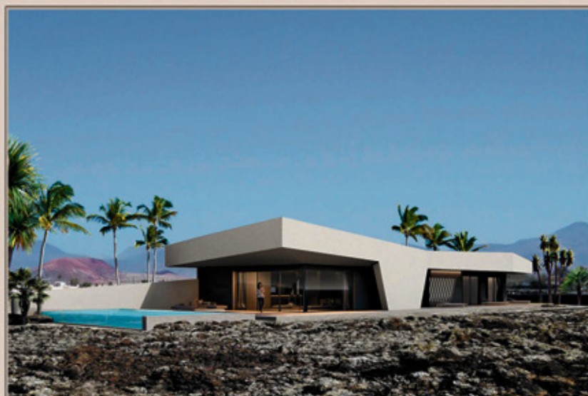
LAJARES VILLA 1