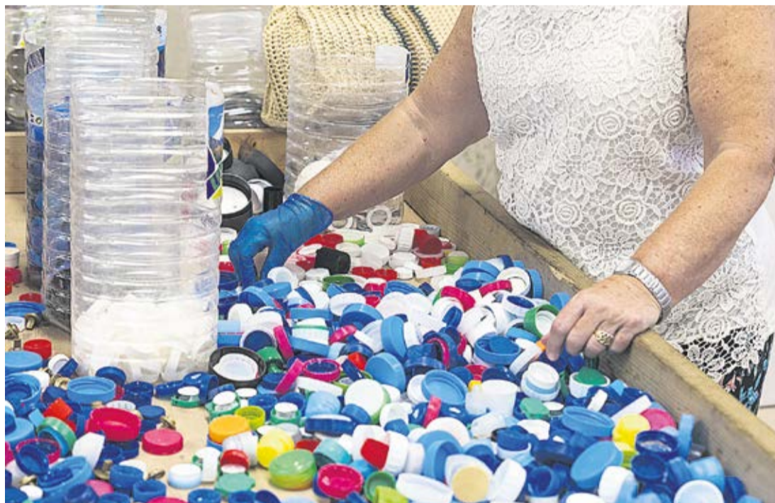
Recogida de tapones solidarios.

y la posibilidad de experimentar de manera humana los detalles de la vida cotidiana”.