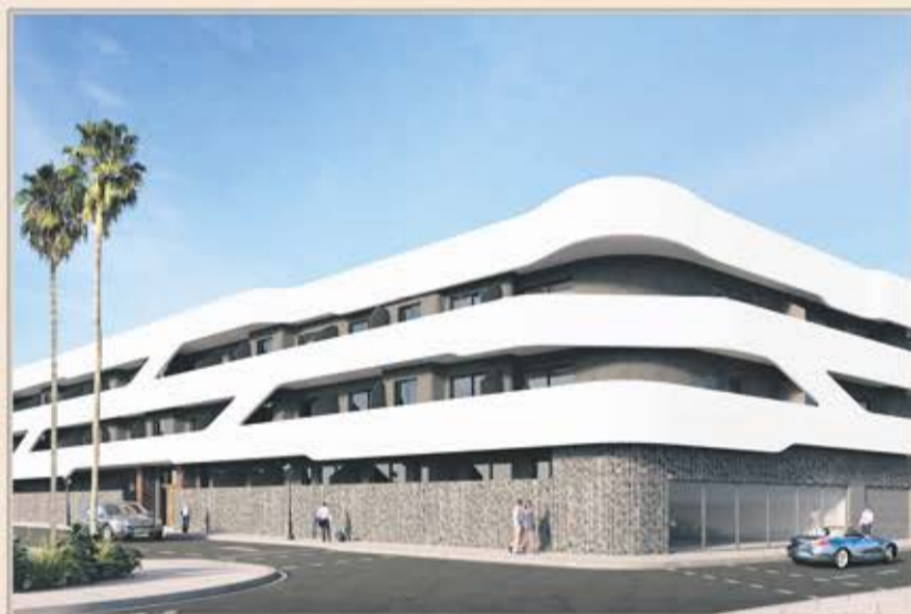
CORRALEJO - VIVIENDAS