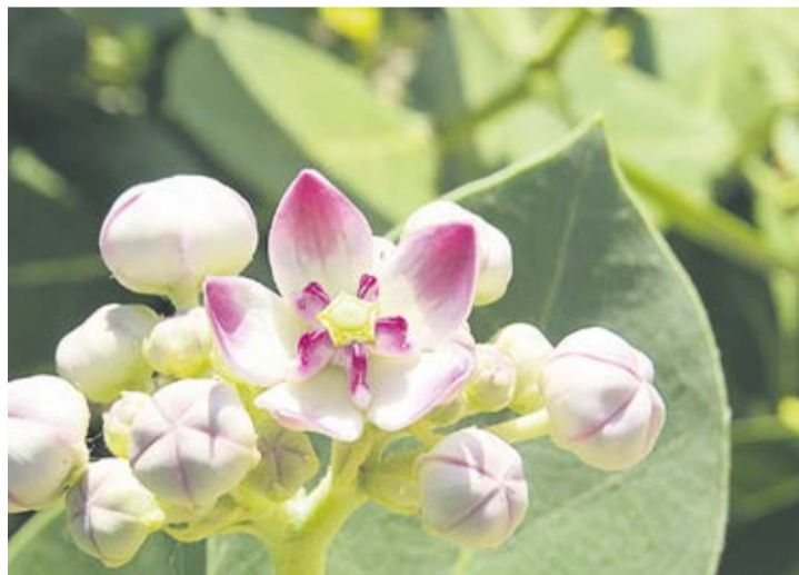
Detalle de la flor del árbol de la seda.