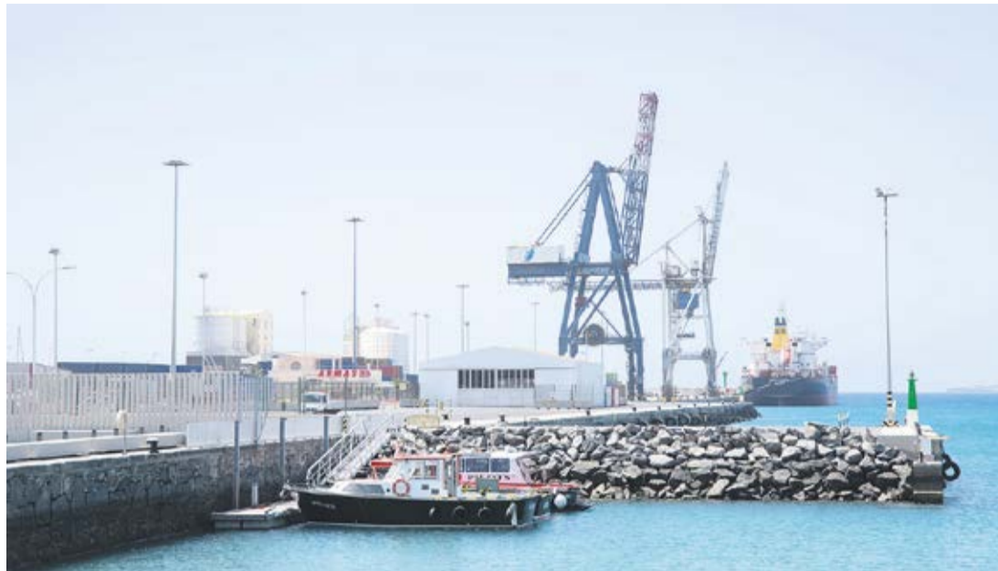
Muelle de Puerto del Rosario.

Tarfaya depende de Torres. En su división inmobiliaria, Newport mantiene el dossier del