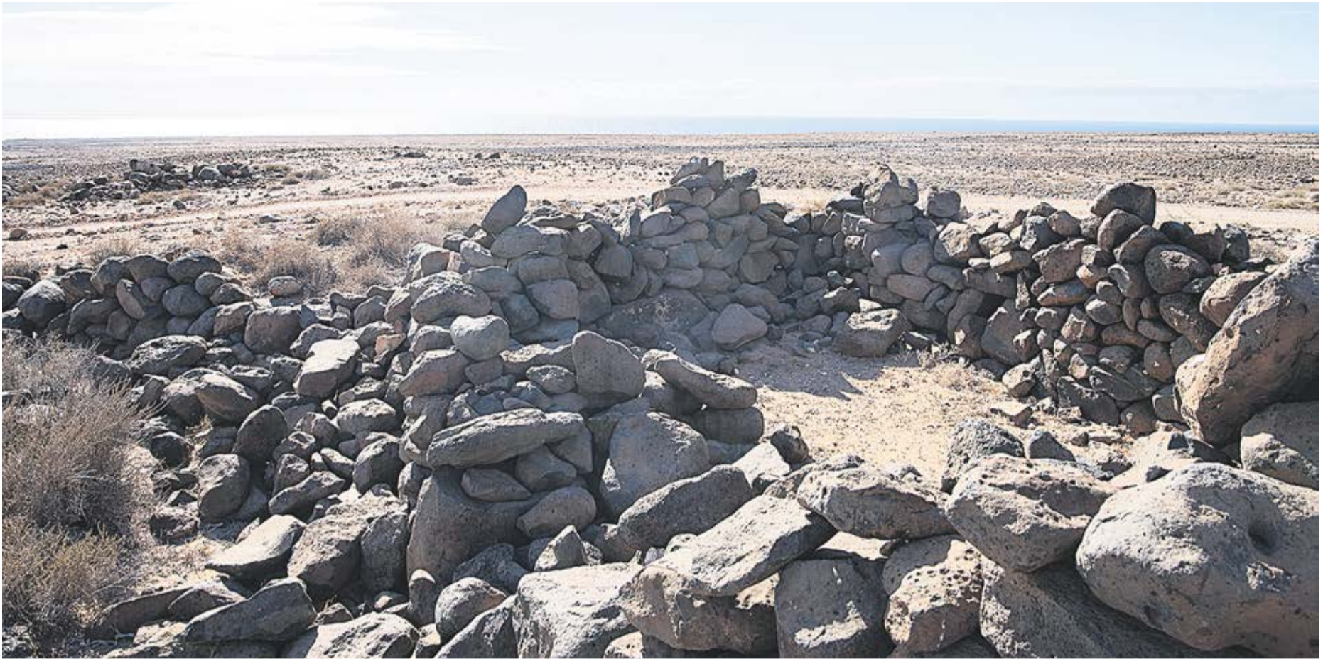
Yacimiento del Llano de Los Ópares, en la zona de Los Molinos.