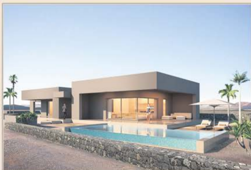
LAJARES - VILLA 2