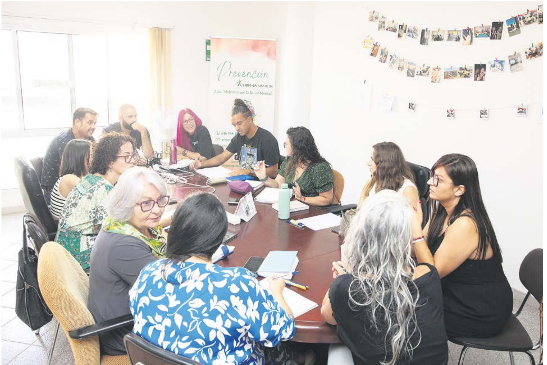
Reunión del colectivo Asomasamen.