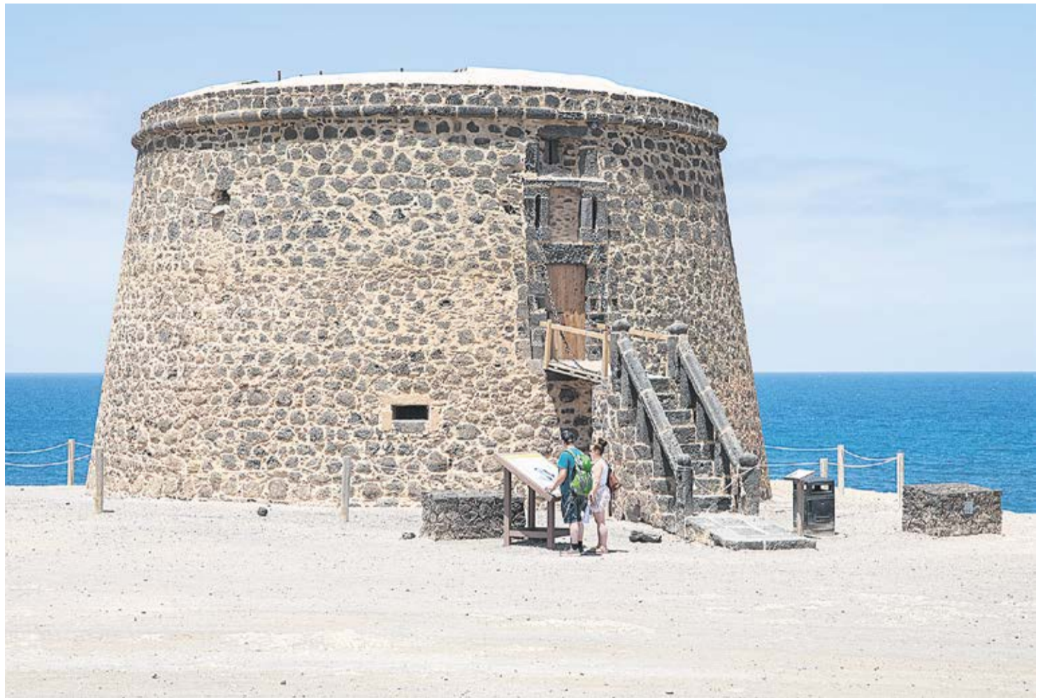
Torre del Tostón en El Cotillo, ejemplo de fortificación para la defensa de Fuerteventura.

Para Fuerteventura y Lanzarote, el rey era el encargado de designar al Sargento Mayor, quien se encargaba de organizar y entrenar a las milicias locales, formadas por isleños residentes a los que les tocaba situarse en primera línea en caso de ataque. Otras estrategias de defensa consistían en situar las principales poblaciones lejos de la costa (como Betancuria y Tegüise) y en crear una red de atalayeros, personas de confianza