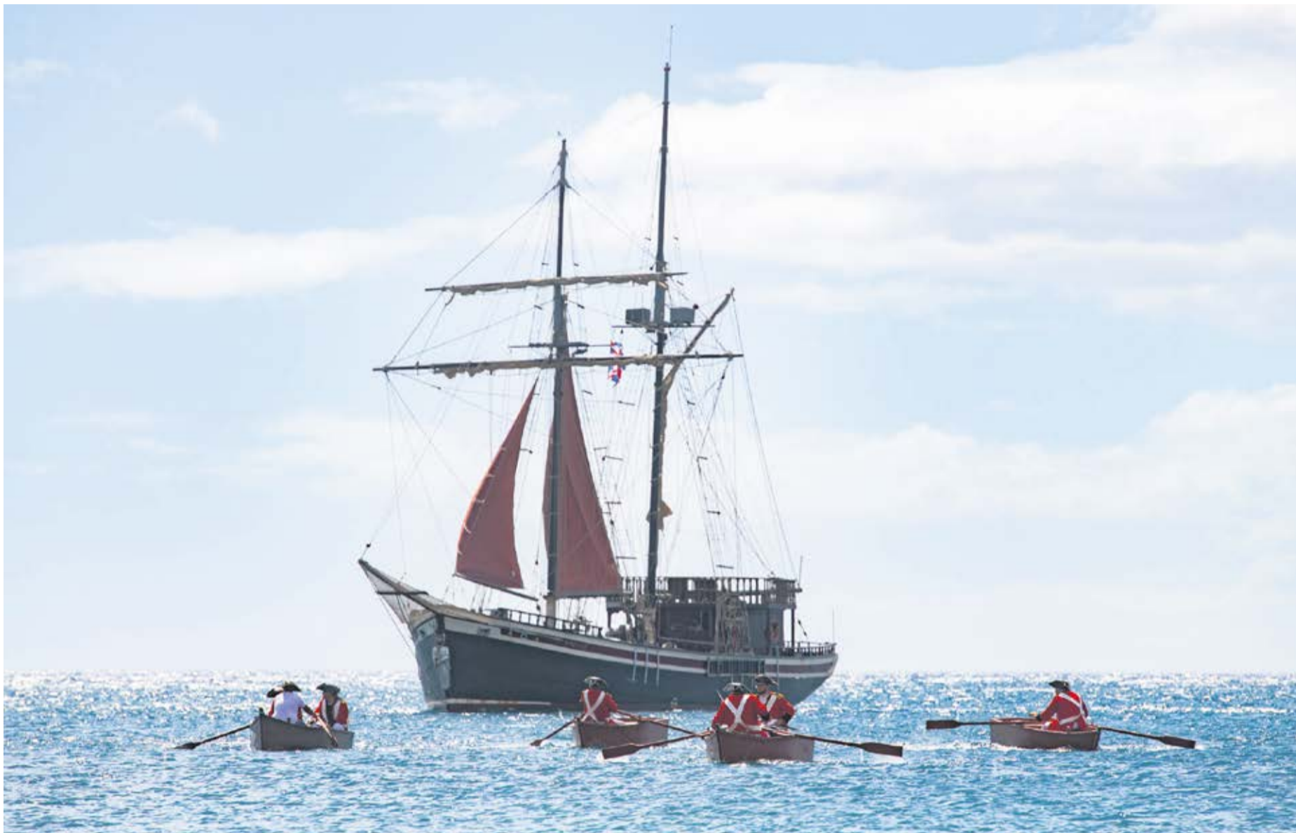
Recreaciones que anualmente realizan vecinos del sur de Fuerteventura de las batallas del Cuchillete y Tamasite, acaecidas en 1740.