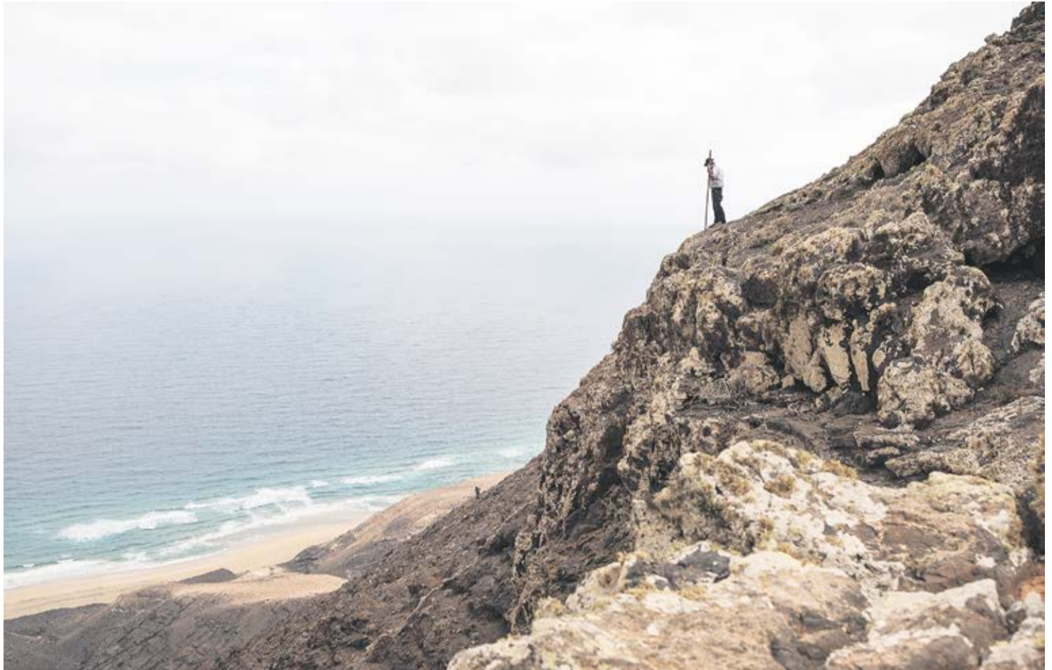
Imágenes de la apañada en Cofete.

El reciente título de Bien de Interés Cultural reconoce el profundo legado de esta tradición ganadera, pero no garantiza una pervivencia que afronta grandes desafíos