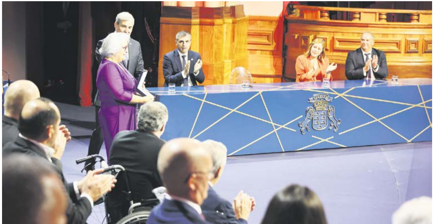
Entrega de la Medalla de Oro de Canarias a Asomasamen.

Otro programa pionero fue Creando veredas , que nació en el año 2021. Los usuarios de la zona sur pedían salir a conocer los parajes de la Isla. Así, se ha conseguido favorecer la salud mental y física, y les ha aportado numerosos beneficios, como respirar aire puro o poder evadir la mente simplemente observando los paisajes que les rodean. Para el guía, Alejandro Abaroa, es una actividad que proporciona “libertad, felicidad