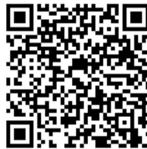
QR de descarga de la guía.

Comenzó en la ilustración porque tenía necesidad de comunicar y cree que en muchas ocasiones “las palabras caen en saco roto y la imagen capta mejor la atención”. “A los ni-