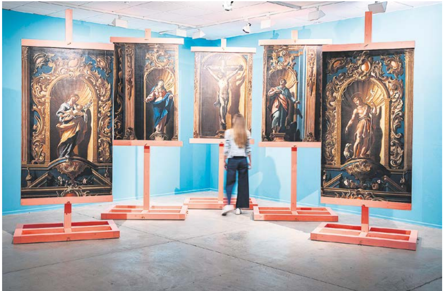
El políptico de la Iglesia de La Oliva, expuesto en la sala Juan Ismael.