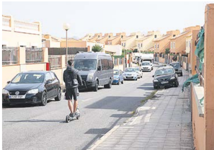
Interior de la urbanización.

En el complejo se ven fachadas y barandillas desconchadas, humedades, y se acumula