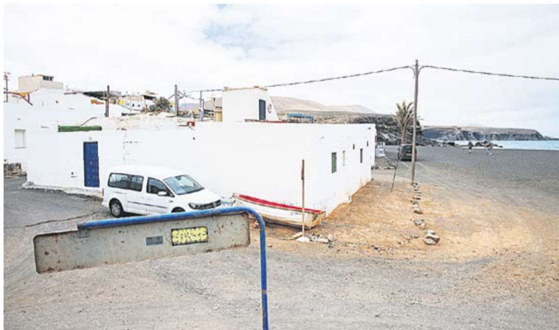
Ajuy, en la costa del municipio de Pájara.

viviendas. En Los Molinos ya se han derribado, en el pasado, algunas de las construcciones, pero por ahora el pueblo contiene la respiración mientras espera una salida que no llega.