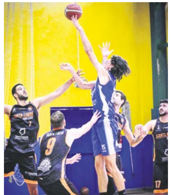
Equipos de los Toscones, de varias categorías diferentes.