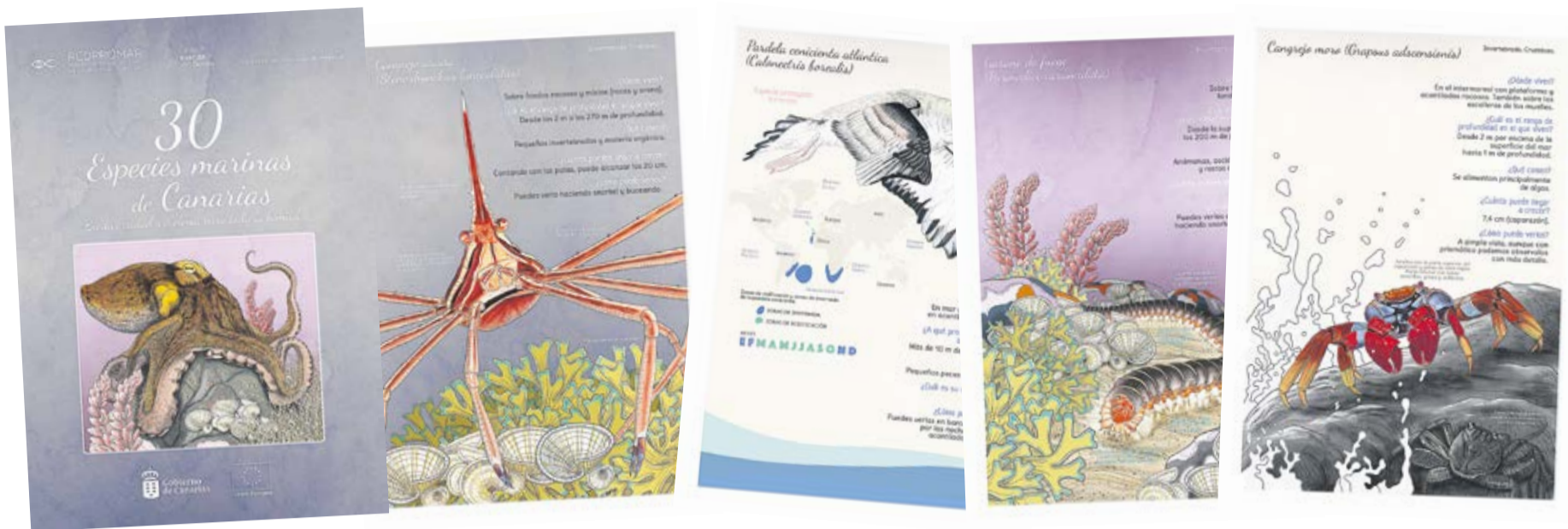
Diversas ilustraciones que contiene la guía.

que has conocido en el libro o al revés, si se reconocen en la obra las que se ven en el medio marino, pero separarnos del medio no nos ayuda a entender la interacción entre las especies y la naturaleza”.