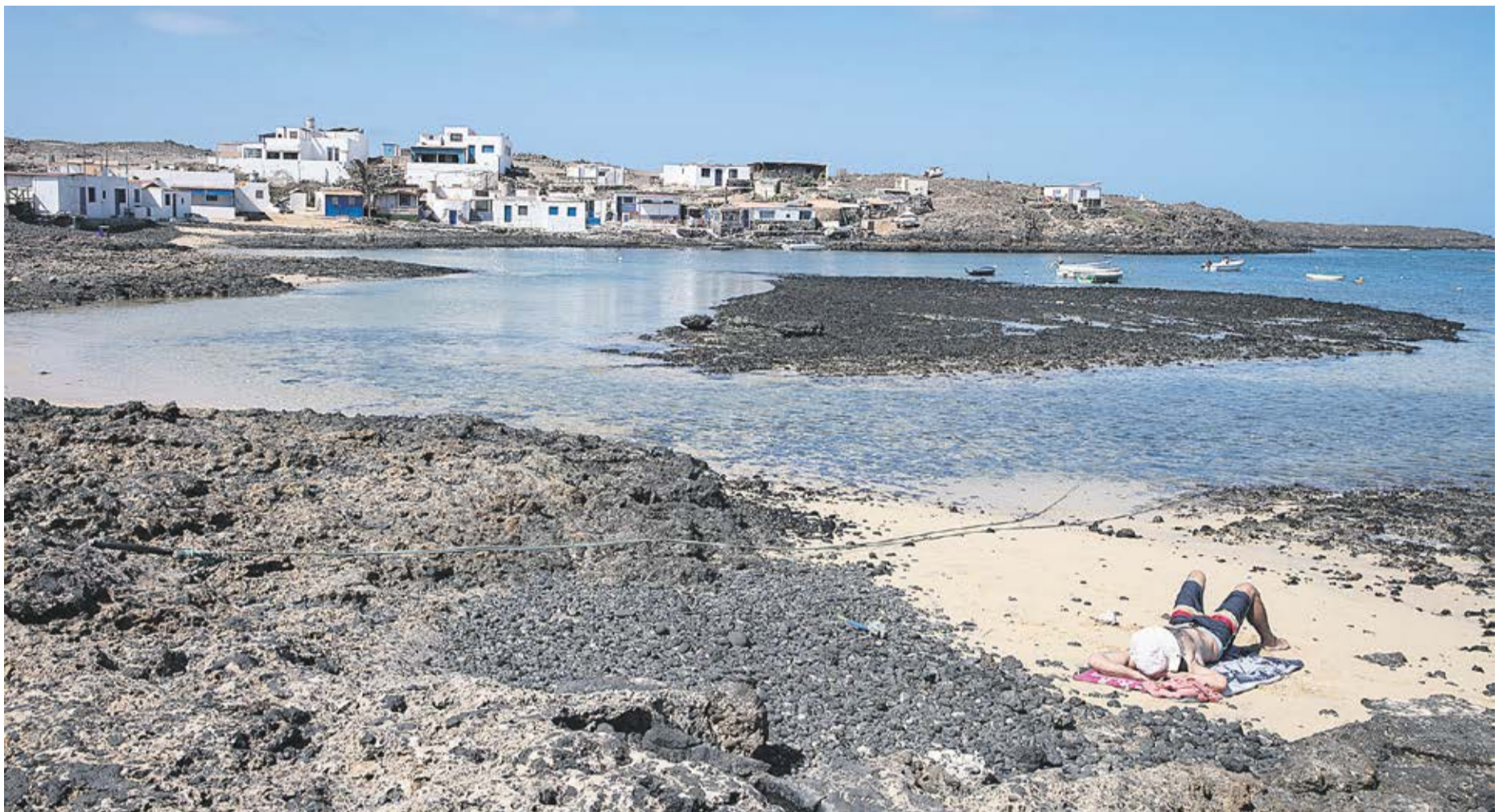
Viviendas en primera línea en Majanicho.