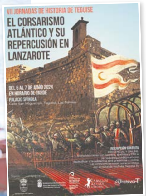
Cartel del congreso que se celebra en Tegüise entre el 5 y el 7 de junio.

que eran pagadas por el Cabildo insular para otear el horizonte desde lugares altos y avisar a las autoridades desde que vieran asomarse alguna amenaza.