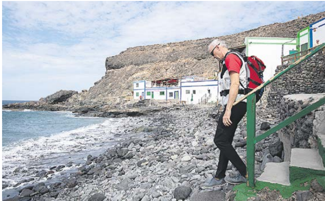
Los Molinos, en Puerto del Rosario.

En cualquier caso, la situación de Los Molinos no es nueva. Las acciones del Ministerio para despejar el dominio público marítimo terrestre en esta parte de la costa mayorera se remontan a 1994. La actividad de Costas ha experimentado vaivenes y, durante años, los expedientes han permanecido paralizados. Al retomarse, ha cundido la preocupación en todo el núcleo costero en el que la quincena de edificaciones más antiguas que siguen en pie se remonta a los años 20 del siglo pasado. De la década de los 70 son otro buen número de