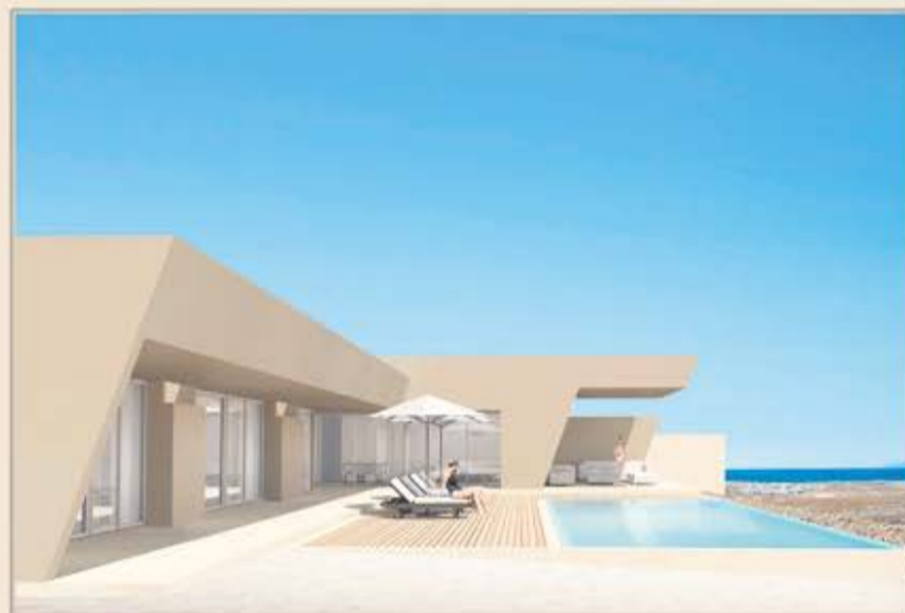
CORRALEJO - VILLA 1