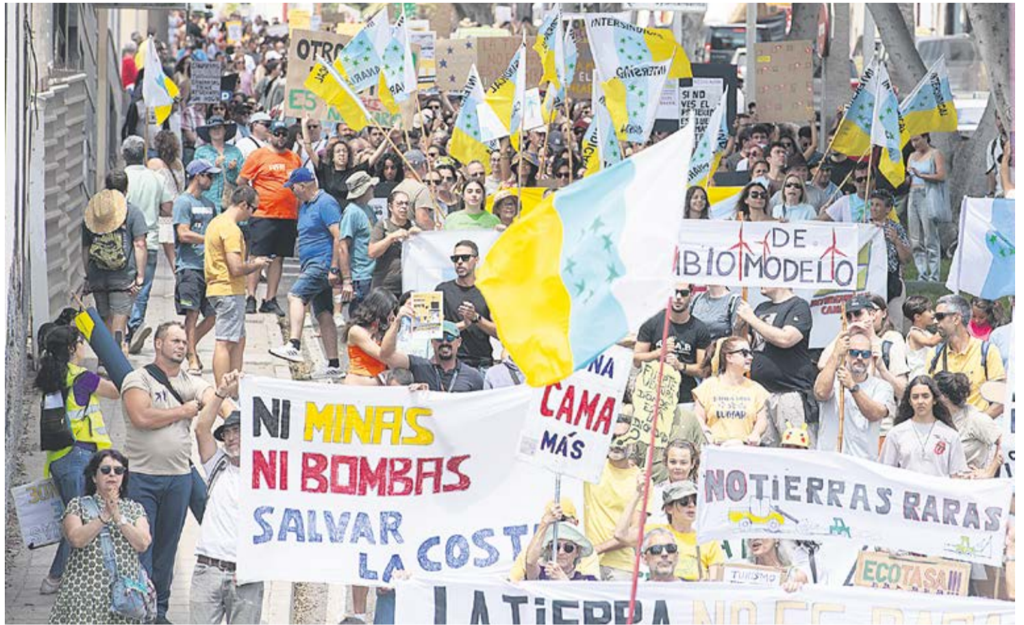
Pancartas contra la exploración de tierras raras, en la manifestación del 20 de abril.

Justo a mitad de abril se habían conocido los detalles de la tercera solicitud del grupo Satocan: otros 25 kilómetros cua-