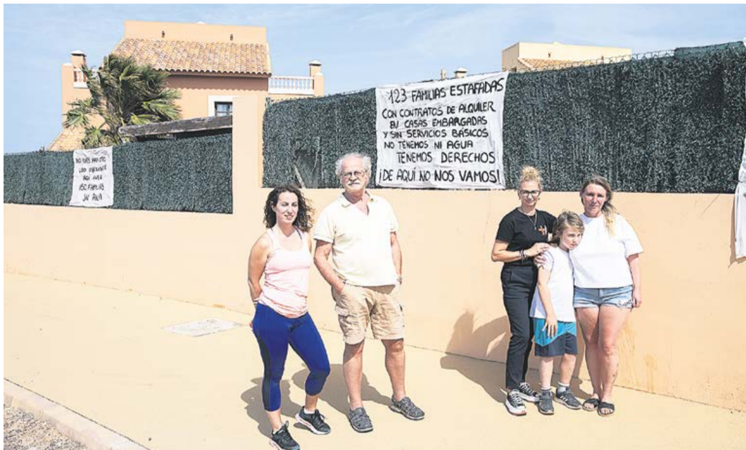
Vecinos de Mirador de Lobos.

Un centenar de inquilinos defiende sus contratos de arrendamiento, con pagos por adelantado, y espera a la resolución final de la subasta de las viviendas