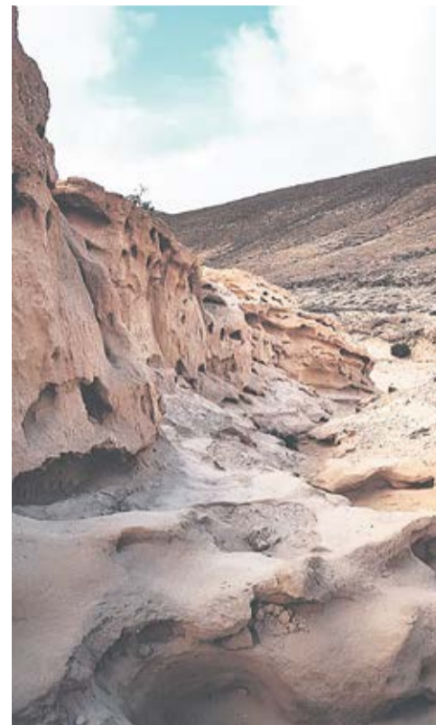
Imágenes del Barranco de Los Encantados.

yacimientos prehistóricos. Entre ellos el yacimiento de Tierra Mala, con una estación de grabados rupestres, la mayoría de ellos alfabetiformes.