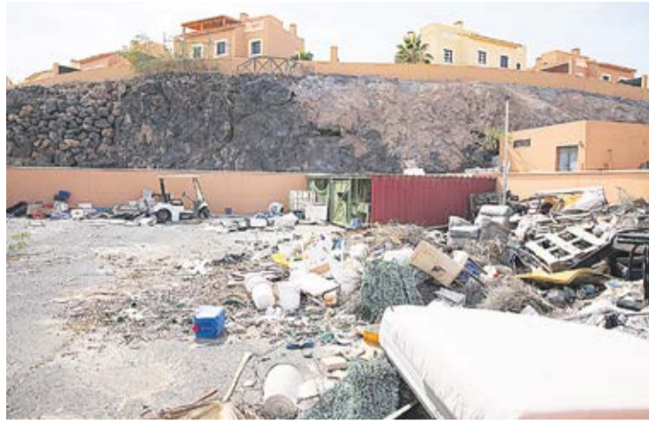
Estado de abandono de alguna de las zonas comunes.

El aspecto del campo de golf central es desolador: todo el terreno y vegetación se ha secado y en la antigua recepción del complejo han abierto un restaurante privado. Una vecina italiana que conocía el complejo cuando funcionaba como resort con campo de golf y que entró