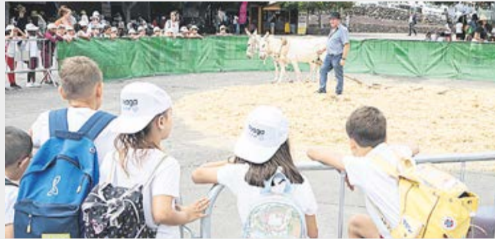
Niños en FEAGA.

Y el Baile de Taifas como un torbellino de música y color se instala cada año en las puertas de tu casa, para que no tengas que coger el coche y pasar frío. Noche donde los sabores se entremezclan, y lo mismo te da comerte unas garbanzas que unos macarrones a la boloñesa, todo te cabe en la ropa ataviada para la ocasión, que lo mismo parieron costureras con esmero que el chino de la esquina.