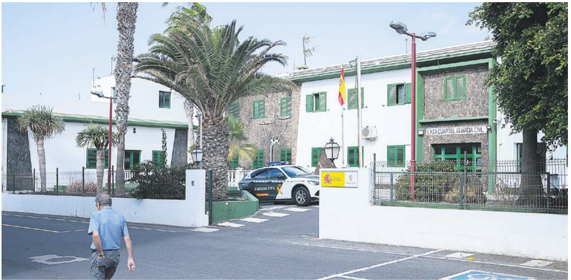
Cuartel de la Guardia Civil en Puerto del Rosario.