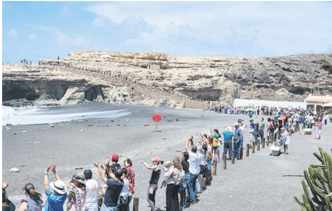
Concentración en Ajuí contra la exploración de tierras raras en Fuerteventura.

Este discurso, sin embargo, utilizado hasta la saciedad por “expertos” cercanos, de una manera u otra a la industria minera, conlleva un mensaje oculto: debemos elegir entre extraer tierras raras en la “remota isla”