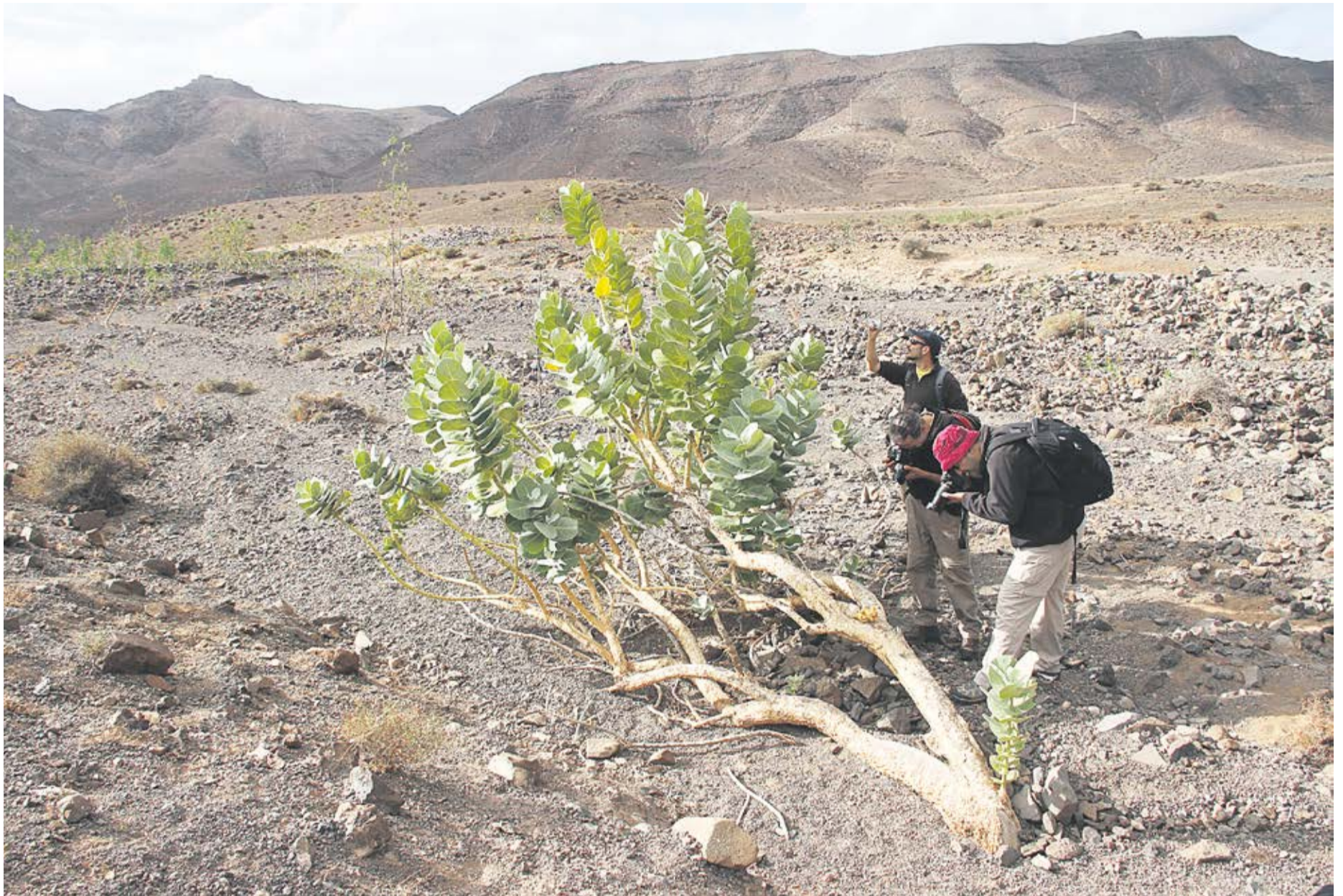
Árbol de la seda en Vigán.